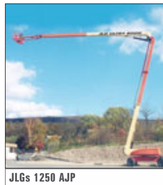
JLGs 1250 AJP

haben der Terex Demag AC 1000 und der Liebherr LTM 11200-9.1 ihre bisherigen Artgenossen genüsslich distanziert. Im Vorjahr lag der Spitzenwert hier noch bei 150 Metern. Obendrein hat der Neunachser aus Ethingen als erster die Traglastmarke von 1000 Tonne übersprungen – und das