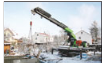
Palfingers Schwerlastkran PK 150002 in Hamburg

die Maschine schon lange fertig ist, wurden diese Zahlen präzisiert, sodass nun die exakte Hubhöhe von 24,84 Metern feststeht. Außerdem ist das Genie-Gerät die Maschine mit der höchsten Tragkraft in der Liste von Kran & Bühne : sechs Tonnen.