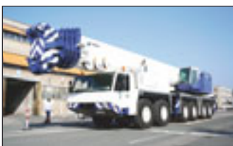
Tadanos neuer Sechssachser, der ATF 360G-6

Souverän thront der Manitou MRT 3050 auf dem Spitzenplatz der Teleskoplader. Mit seiner Hubhöhe von knapp 30 Metern bleibt er auch in der diesjährigen Zusammenstellung unerreicht. Unverändert bleibt sogar die Gesamtheit der aufgeführten Teleskoplader, nur ihre Reihenfolge ändert sich geringfügig. Einen Satz nach vorne gemacht hat der überarbeitete Pegasus 40.25 aus der Produktion von Dieci. Seine Hubhöhe liegt nun bei 24,50 Metern. Für den GTH-6025R von Genie lagen im vergangenen Jahr lediglich vorläufige technische Daten vor. Nun, da