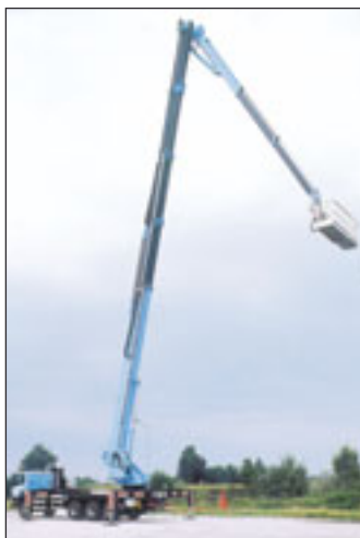
LKW-Bühne aus Barin-Produktion

Allzu gelenkig mussten die Gelenkteleskope Anno 2008 gar nicht sein, um ihre Position zu halten: Nahezu alle Vertreter aus dem Vorjahr sind wieder an Bord, und alle landen fast auf denselben Plätzen. Allerdings ist die UpRight AB85RJ mit 18,90 Meter maximaler Reichweite neu hinzugekommen. Schade, dass dafür die Haulotte HA 260 PX herausgeflogen ist, denn schließlich wurde sie – zusammen mit ihrer Schwester HA 41 PX – überarbeitet. Beide haben ihre Werte gesteigert. Die Große kommt jetzt auf 41,5 Meter Arbeitshöhe (plus 50 Zentimeter), und die Kleine konnte bei der Reichweite von 15,60 auf 16,20 Meter zulegen.