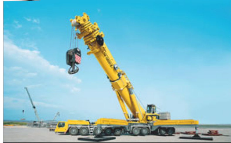
Liebherr's Flaggschiff, der Neunachser LTM 11200-9.1