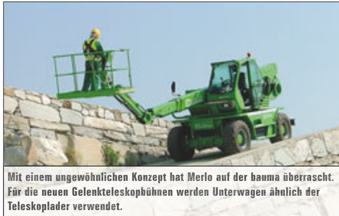
Mit einem ungewöhnlichen Konzept hat Merlo auf der bauma überrascht. Für die neuen Gelenkteleskopbühnen werden Unterwagen ähnlich der Teleskopklader verwendet.

« den deutschen Händler Wienold Lift vertrieben. Die Maschinen zeichnen sich durch eine leichte Bauweise aus – 2123 Kilogramm für das Teleskop und 1950 Kilogramm beim Gelenkteleskop. Die Korblast von 227 Kilogramm ist für den gesamten Arbeitsbereich ausgelegt. Das Teleskop reicht dabei bis auf 9,8 Meter hinaus, das Gelenkteleskop mit einem Gelenkpunkt bei 6,1 Meter bis auf 8,2 Meter.