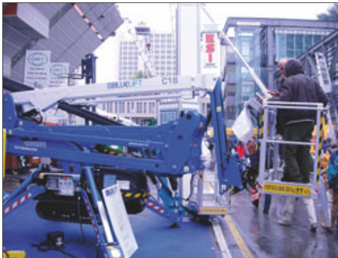
Rothlehner vermarktet seit kurzem auch die Bluelift R180C in Deutschland

Letztes Jahr liefen die Geschäfte über die Maßen gut. So gut, dass sich die Hersteller in erster Linie auf das konzentrierten, was der allgemeine Titel verlautbart: Herstellen. Es wurde produziert und erweitert. In dieser ganzen Hektik fiel das Augenmerk dann nicht mehr so auf die Entwicklung, zumindest wenn man den Bereich der