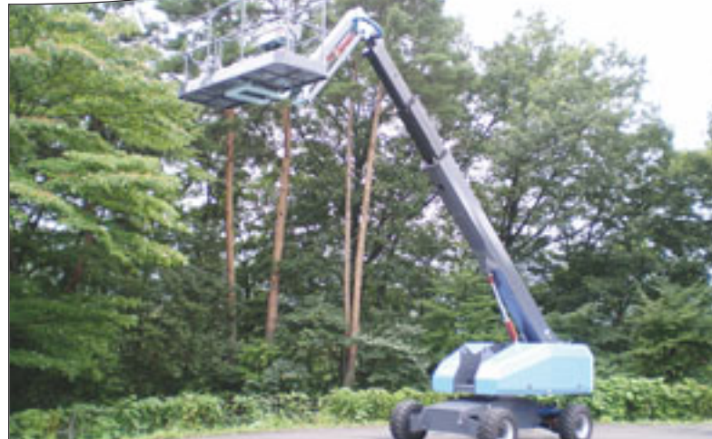
Eine von Aichi's Neuen, die Skymaster SP14CJ

Den vorgezogenen Start ins Jahr 2008 hat denn auch Aichi im Dezember hingelegt. Zwei neue Teleskopbühnen werden das Programm nach unten erweitern. Neben der Skymaster SP12C mit knapp elf Meter Reichweite kommt die SP14CJ mit 12,7 Meter Reichweite hinzu. Namensforscher werden erkennen, dass es sich bei der zweiten um die Variante mit Korbarm handelt. Im Gegensatz zu einigen Mitbewerbern, die auf zweiteilige Teleskopausleger setzen, besteht dieser hier aus drei Elementen, so dass die Gesamtlänge der Maschine bei rund sechs Metern liegt. Zwei Korbgrößen stehen zur Auswahl. Dabei sind beim 1,80-Meter-Modell 250 Kilogramm drin, der größere