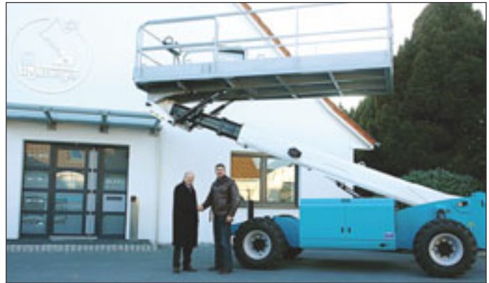
Die erste Manitou 150 TP in Deutschland ist jüngst an Bollmeyer in Kirchlengern ausgeliefert worden. Aufgabenfelder sieht der neue Eigner unter anderem im Tunnelbau.

War es nun letztes Jahr oder doch erst dieses? Die Lesweise, wann das neue Modell von JLG vorgestellt wurde, ist Auslegungssache. Die Premiere hat die neue Teleskopbühne 680 S von JLG auf der SAIE in Italien gefeiert. Offizielle deutsch-