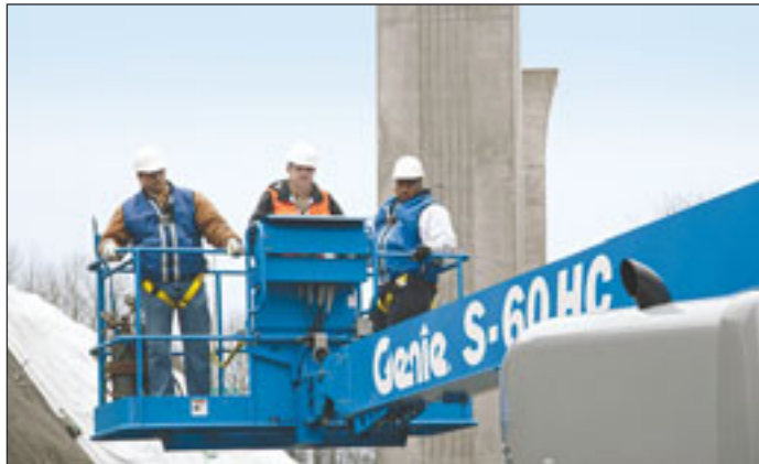
Dank ihrer hohen Korblast kann die neue Genie 60 HC auch drei Personen mit im Korb führen

sprachige Angaben sind erst in diesen Tagen herausgegangen. Abseits dieses Philosophenstreites zeigt das Gerät seine Stärken in einer Reichweite von 18 Metern bei einer maximalen Arbeitshöhe von 22,73 Metern. Der satte 4,06 Meter breite Korb verfügt über eine Korblast von 230 Kilogramm. Die rund 16 Tonnen schwere Maschine überwindet zudem Steigungen bis 45 Prozent.