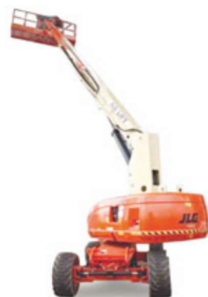
Die neue JLG 680 S