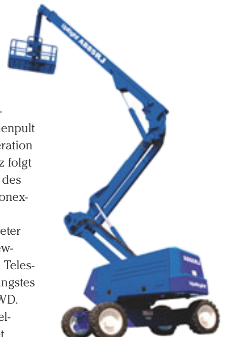
In neuen Farben und mit neuer Bezeichnung: die UpRight AB 85RJ

Im Bereich 17 bis 26 Meter fühlt sich derzeit der „Newcomer“ H.A.B. in Sachen Teleskopbühnen wohl. Sein jüngstes Produkt ist die T 17 J E4WD. Aus dem Steno der Kürzelschrift übersetzt bedeutet dies schlicht, dass das Unternehmen nun auch ein