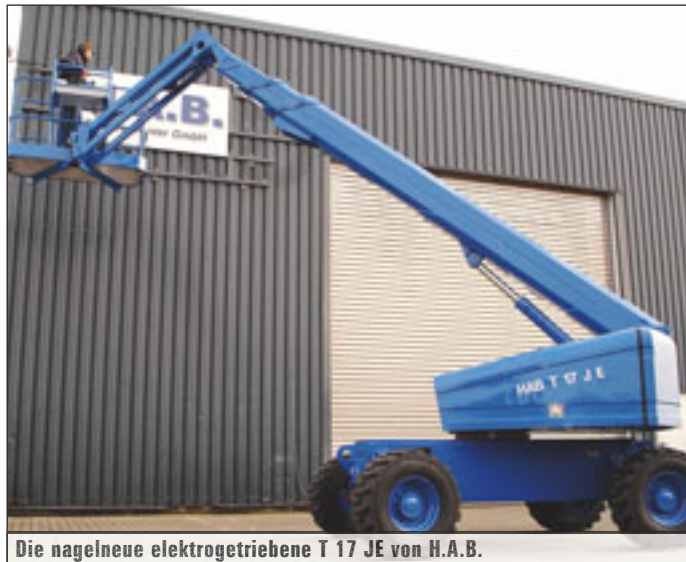
Die nagelneue elektrogetriebene T 17 JE von H.A.B.

Mit neuem Vertriebspartner ist letztes Jahr BilJax in Deutschland aufgetreten und hatte gleich zwei Selbstfahrer mit im Gepäck. Neben dem 13,4-Meter-Teleskop SLT-3632T wird auch das Gelenkteleskop SLT-4527A mit 15,7 Meter Arbeitshöhe über ▶▶