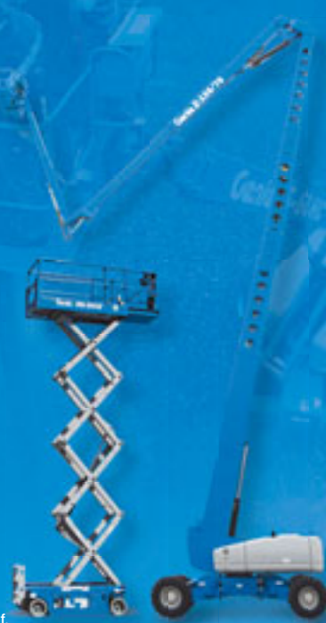
Genie® ist ein eingetragenes Warenzeichen von Genie Industries, Inc. in den U.S.A. und vielen anderen Ländern. Genie ist ein Terex Unternehmen. Copyright 2007 Genie Industries, Inc. Alle Rechte sind vorbehalten.

Weitere Informationen über das Unternehmen finden Sie im Internet unter: www.genieindustries.com