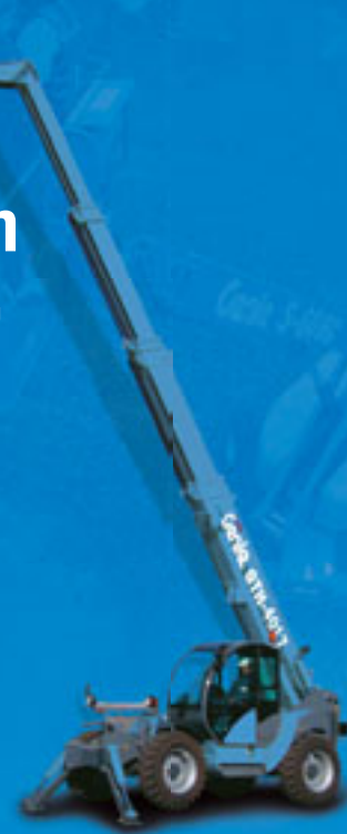
Genie® ist ein eingetragenes Warenzeichen von Genie Industries, Inc. in den U.S.A. und vielen anderen Ländern. Genie ist ein Terex Unternehmen. Copyright © 2007 Genie Industries, Inc. Alle Rechte sind vorbehalten.

Weitere Informationen zu Genie erhalten Sie unter: www.genieindustries.com