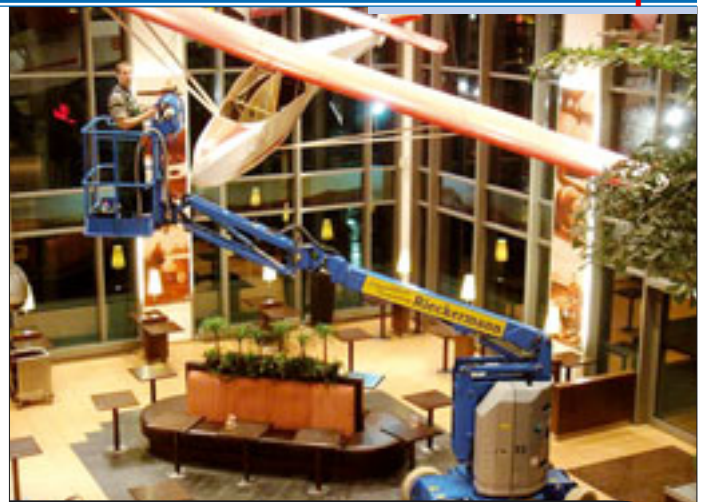
Fast auf 70 Kilometer Arbeitshöhe kommen die Mitglieder der Systemlift AG