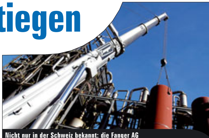
Nicht nur in der Schweiz bekannt: die Fanger AG

Die Konjunkturbelebung schlägt auch auf die Zahlen der großen Vermieter im deutschsprachigen Raum durch. Rüdiger Kopf hat die Zahlen zusammengestellt.