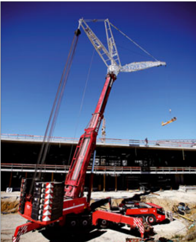
Auf Deutschlands größter Baustelle, der neuen Messe Stuttgart, kamen auch zahlreiche Krane von Scholpp zum Einsatz

davon aus, dass ein Jahr Wartezeit auf den neuen Großen nichts außergewöhnliches mehr sei.