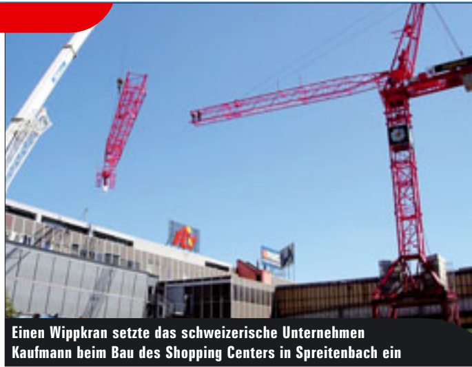
Einen Wippkran setzte das schweizerische Unternehmen Kaufmann beim Bau des Shopping Centers in Spreitenbach ein

Weniger einheitlich viel die Auswertung für die Turmdrehkrane aus. Hier streuten die Antworten von zwei bis zwölf Monaten, wobei die Tendenz schon