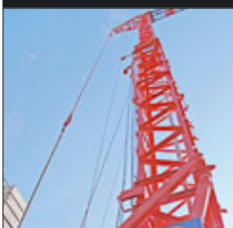
Arcomets A45D hat eine Hakenhöhe von 30,5 Metern

Der erste Linden 8000 Kran, so das Unternehmen, war sehr wahrscheinlich der erste Flat-Top-Kran überhaupt, wobei der Begriff Flat-Top erst in den neunziger Jahren von Comansa sozusagen erfunden worden sei. Zwei spitzenlose 21LC400 mit 18 Tonnen maximaler Traglast und ein Wippkran vom Typ LCL250 mit bis zu zwölf Tonnen Traglast sind derzeit beim Crystal Tower Projekt in Madrid im Einsatz. Mit 249