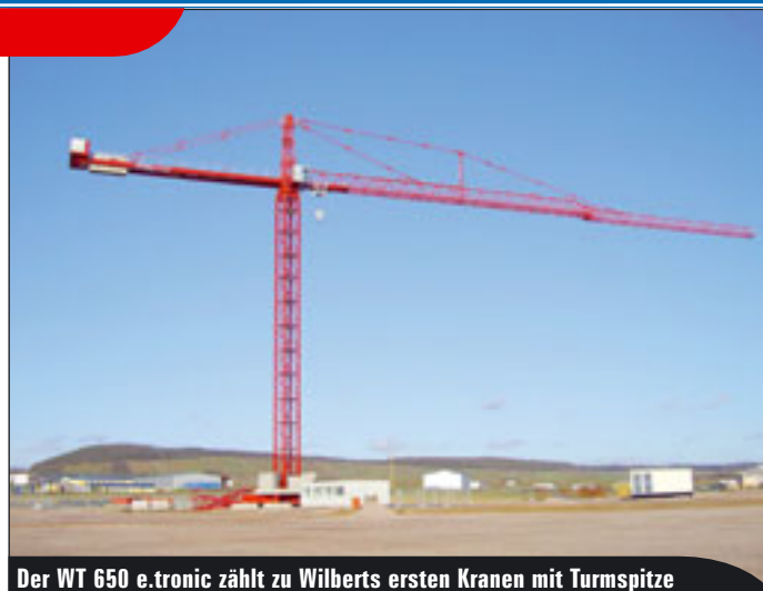
Der WT 650 e.tronic zählt zu Wilberts ersten Kranen mit Turmspitze

Potain bringt zur bauma zwei neue Igo-Schnellmontagekrane, den Igo T 70 und den Igo MC 13. Das Besondere am