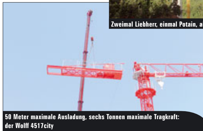
50 Meter maximale Ausladung, sechs Tonnen maximale Tragkraft: der Wolff 4517city

me umfassende Costanera Center in Santiago, Chile, liefern die Süddeutschen gleich ein ganzes Dutzend Turmdrehkrane der Größenklasse zwischen 90 und 200 mt. Zum Einsatz kommen Flat-Top-Krane der Baureihe EC-B, Katzausleger-Krane der Baureihe EC-H sowie Nadel-