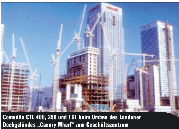
Comedils CTL 400, 250 und 161 beim Umbau des Londoner Dockgeländes „Canary Wharf“ zum Geschäftszentrum

Zum malaysischen Unternehmen Muhibbah gehört der in Dänemark ansässige Kranhersteller Krøll mittlerweile. Mit Pekazett-Kranen ist KSD am Markt vertreten. Von König Krane kamen zuletzt die Modelle K70 und K72 auf den Markt. Koenig Cranes North America ist Händler für König und Wilbert. K&B