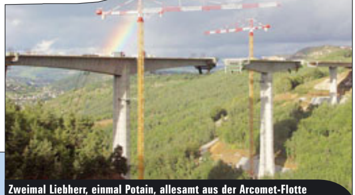
Zweimal Liebherr, einmal Potain, allesamt aus der Arcomet-Flotte

Auch knapp 60 Jahre nachdem Hans Liebherr seinen ersten mobilen Turmdrehkran konstruiert hat, hat Liebherr noch Spektakuläres zu bieten. Für das vier Bürotür-