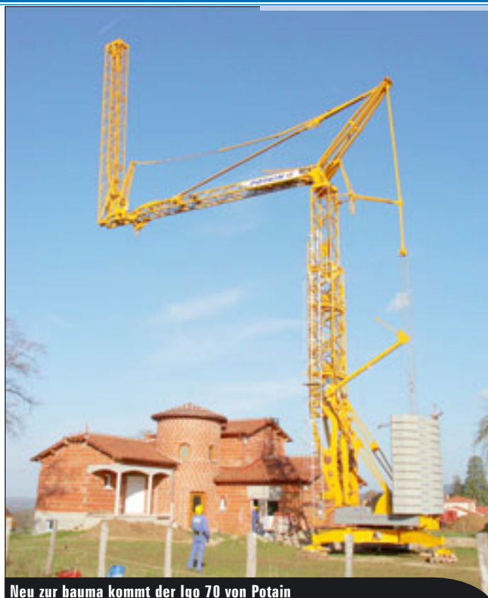
Neu zur hauma kommt der Igo 70 von Potain

Metern und 50 Etagen ist der „Torre de Cristal“ hier eines der höchsten Gebäude.