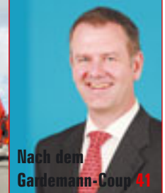
Nach dem Gardemann-Coup 41