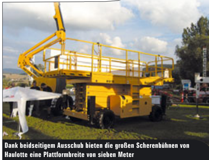
Dank beidseitigem Ausschub bieten die großen Scherenbühnen von Haulotte eine Plattformbreite von sieben Meter

ses Equipment nun hinzugefügt. Über deren Sinn und Nutzen sind indes die Anwender sehr unterschiedlicher Meinung. Eines war aber bei allen Vermietern herauszuhören. Einige Kunden, die Scherenbühnen schon seit langem nutzen, kennen die kleinen Kraftpakete und haben nicht zu selten die Grenzen ausgetestet – und nicht immer eingehalten. Drücke wurden erhöht und Lasten aufgeladen, die nicht mehr zulässig waren. Durchaus keine Einzelfälle, was ganz klar auf Kosten der Sicherheit gegangen ist. Und nun lässt eine Korblastüber-