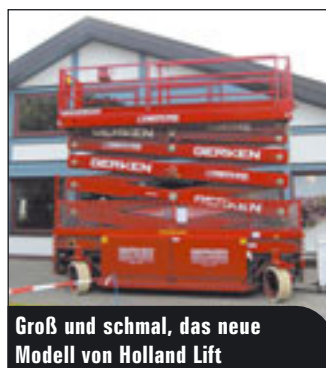
Groß und schmal, das neue Modell von Holland Lift