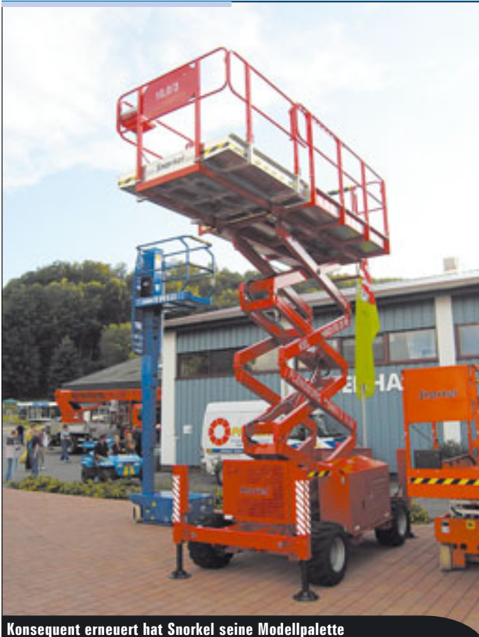
Konsequent erneuert hat Snorkel seine Modellpalette

◀ Mit sechs Modellen ist PB Liftechnik vor zwei Jahren auf den Markt gekommen. Sie zeichnen sich unter anderem durch nach oben verjüngende Scherenpakete aus. Die Geräte stehen in 1,2 Meter Breite und 1,6 Meter Breite und Arbeitshöhen zwischen zwölf und 17 Meter zur Verfügung. PB erweitert im kommenden Jahr seine Modellreihe um zwei Modelle mit 19 und 22 Meter mit einer Breite von 1,2 Meter.