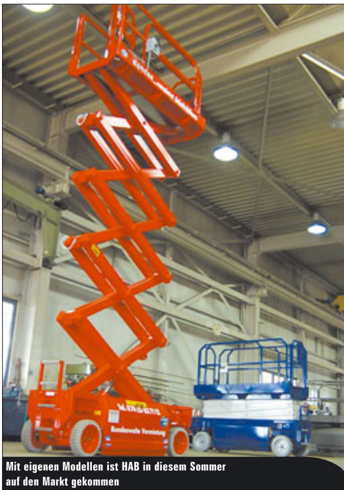
Mit eigenen Modellen ist HAB in diesem Sommer auf den Markt gekommen

Alltagsgerät in der Arbeitsbühnenbranche, die Scherenbühne, findet sich seit geraumer Zeit mit einer neuen Situation zurecht. Seit der Einführung der EN 280 sind alle neuen Modelle mit einer Korblastüberwachung auszustatten. Manche Geräte hatten schon immer die Korblastabfrage, andere haben die