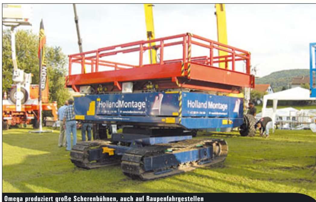
Omega produziert große Scherenbühnen, auch auf Raupenfahrgeräten

Nach den einschneidenden Forderungen der EN 280 hat auch Iteco einen einschneidenden Schritt begangen. Die komplette Produktion der alten Modelle wurde eingestellt und durch Geräte ersetzt, die nach einer komplett neuen Philosophie entwickelt wurden. Die Geräte der so genannten IT-Baureihe orientieren sich in Bezug auf Lastwaage und Scherenschutz und vielem mehr an der Euro-Norm EN 280. Das bedeutet, dass die Maschinen so konstruiert sind, dass die komplette Nennlast der Plattform auch auf der so genannten Plattformverlängerung anliegen darf. In Deutschland werden die Geräte inzwischen über Bielefeld Arbeitsbühnen vertrieben. »