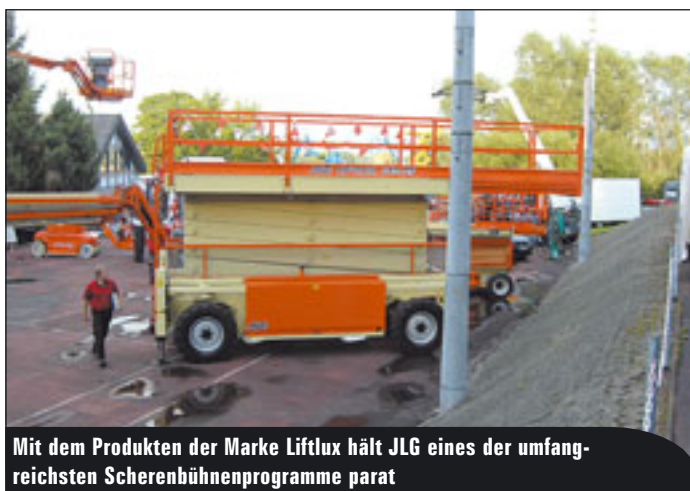
Mit dem Produkten der Marke Liftlux hält JLG eines der umfangreichsten Scherenbühnenprogramme parat

Die Hersteller haben allesamt auf die Forderungen der EN 280 reagieren müssen und haben ihre Geräte „Norm-gerecht“ ausgestattet. Bezüglich Neuheiten zeigt sich das aktuelle Jahr zurückhaltend und haut damit in die traditionelle Kerbe der „baumavorjahre“. So hat JLG nun konsequent die Baureihe „Liftlux“ in