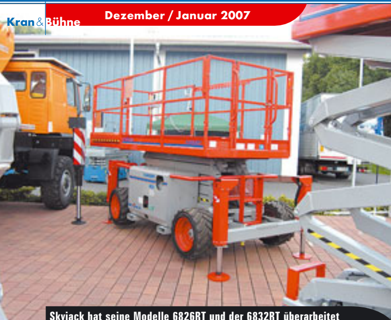
Skyjack hat seine Modelle 6826RT und der 6832RT überarbeitet

« Geräten nachgelegt. Der Scheren-Spezialist präsentierte im Sommer die N265EL13-4WDS auf den Platformers' Days. Hier stand das 26,5-Meter-Gerät in den Farben von Gerken. Die Elektroschere der N-Serie ist trotz der großen Höhe gerade einmal 1,3 Meter breit und verfügt über einen Allradantrieb.