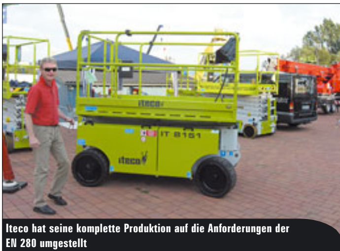
Iteco hat seine komplette Produktion auf die Anforderungen der EN 280 umgestellt