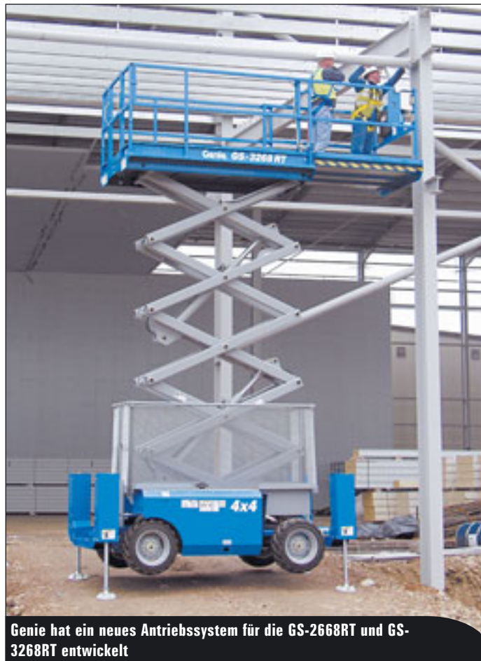
Genie hat ein neues Antriebssystem für die GS-2668RT und GS-3268RT entwickelt

sein Programm integriert und sowohl Elektro- als auch Dieselscheren dieser Marke seit kurzen im Angebot. Von acht bis 34 Meter Arbeitshöhe reicht damit die umfangreiche Auswahl.