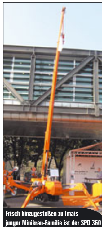
Frisch hinzugestoßen zu Imais junger Minikran-Familie ist der SPD 360

Vor Jahresfrist stellte Multitel Pagliero die 20-Meter-LKW-Bühne MX200 auf der SAIE aus – nun ist das 300. Exemplar verkauft worden. Rein rechnerisch macht das fast eine Maschine pro Werktag... Isoli hat verkündet, dass es nun Versalift in Italien vertreten wird.