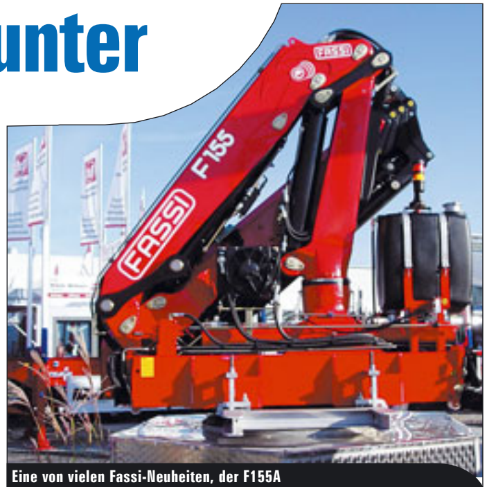
Eine von vielen Fassi-Neuheiten, der F155A

er. „Wir hatten sehr gute Kontakte“, schwärmte er von der SAIE. Auch an den deutschen Markt will CMC im Jahr 2007 verstärkt herangehen und den Verkauf von 50 Einheiten anpeilen.