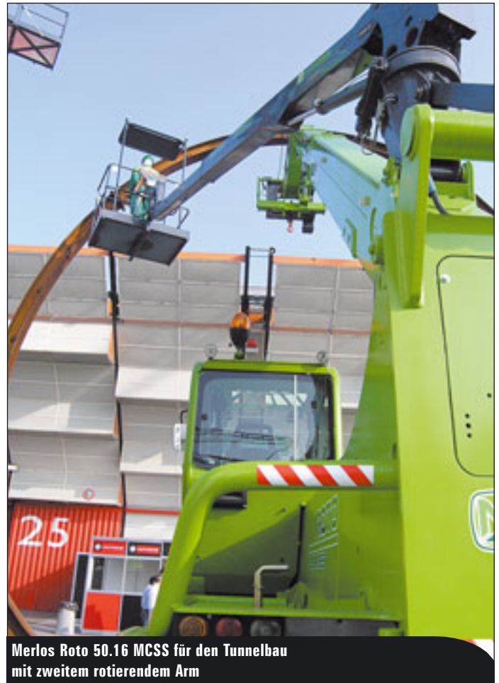
Merlos Roto 50.16 MCSS für den Tunnelbau mit zweitem rotierendem Arm

Die 29-Meter-Bühne E290PX auf einem Iveco 7,5-Tonner zeigte GSR. Dazu die E200T auf einem Sprinter-Chassis mit Teleskop und 12,9 Meter seitlicher Reichweite. An der neuen LKW-Bühne Jet 200 aus dem Hause Leader war das neuartige patentierte Abstützsystem von Interesse: herausklappbare Stützen mit einem einzigen Hydraulikzylinder. Alle Zylinderschläuche und Kabel werden innen geführt. Das Exponat war ein Prototyp. Zum Jahreswechsel soll die Produktion anlaufen.