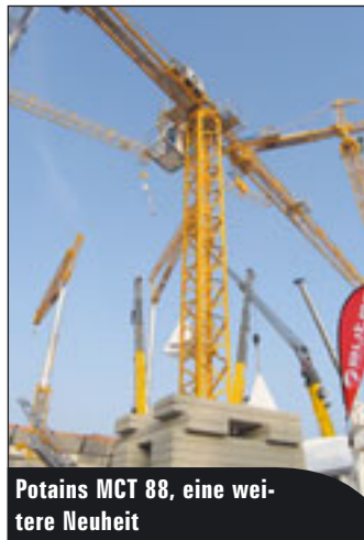
Potains MCT 88, eine weitere Neuheit