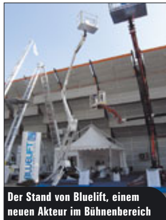
Der Stand von Bluelift, einem neuen Akteur im Bühnenbereich

Imai trumpfte mit seiner Minikran-Baureihe Jekko auf. Jüngstes Mitglied ist der SPD 360, dessen Prototyp zu sehen war: voll und ganz auf vergleichsweise schwere Lasten in Höhe ausgelegt. Zudem ist geplant, das Engagement in Deutschland zu verstärken. CMC setzte auf ein anderes Tier, und zwar den Elefanten. Die neue Gelenkteleskopbühne SUP Elevant S-125 auf Raupenfahrgestell ermöglicht eine Arbeitshöhe von 12,5 Metern, ist dabei nicht breiter als 85 Zentimeter und bringt knapp 1,5 Tonnen auf die Waage. Um 350 Grad kann der „Elevant“ rotieren. An größeren Versionen wird schon fleißig gewerkelt. Bereits jetzt zu sehen war die 36-Meter-LKW-Bühne PLJ 360. Zur bauma soll gar ein 48-Meter-Modell gezeigt werden. Interessant daran ist, dass die Maschine nie höher als zwei Meter ist, solange sie nicht die 30 Meter überschreitet. Rund 20 Einheiten des Typs S-125 konnte CMC im Handumdrehen absetzen. Mit 30 Prozent Zuwachs insgesamt rechnet Exportmanager Dr. Silvano Pray-