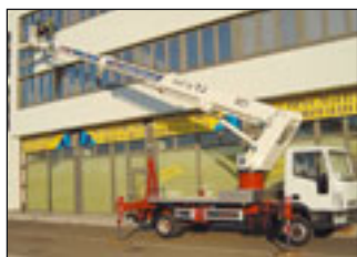
GSR E 228TJ

Bei Rothlehner werden die neue kompakte Raupe R160CL mit 16 Meter Arbeitshöhe sowie die beiden ebenfalls neuen LKW-Bühnen E228TJ und E290PX präsentiert.