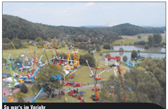
So war's im Vorjahr