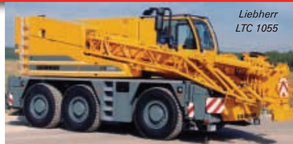
Liebherr LTC 1055

Tonnen Tragkraft dabei. Der in Deutschland erstmals gezeigte Nachfolger des populären GMK3050 ist mit einem neuen sechsteiligen 43 Meter langen Ausleger ausgestattet. Mehr als einen Blick lohnt auch der neue 80 Tonnen RT-Kran RT890E, das nun fünfte Modell aus Groves E-Reihe, der den RT875 und RT 875BXL ersetzt.