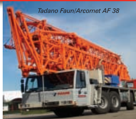
Tadano Faun/Arcomet AF 38

Now it is back across the showground for something more unusual, LIEBHERR'S new compact LTC 1055. The 55 tonne, three-axle unit features 100 per cent hydrostatic drive, a 36 metre main boom and 15 metre double-folding jib for a maximum lift height of 51 metres. Also a first-timer at Bauma is the 750 tonne LG 1750 lattice-tower