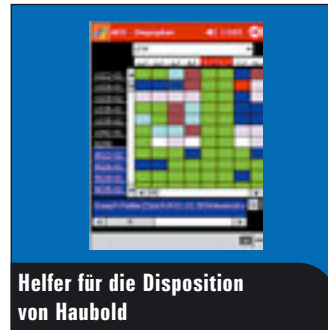
Helfer für die Disposition von Haubold