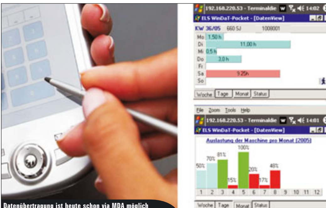
Datenübertragung ist heute schon via MDA möglich

Nicht nur für Vermietunternehmen, auch für die Schwerlastbranche geeignet ist laut Anbieter Matusch die Software EPOS. Besonderheit ist hier die Einbindung von Routenprogrammen, die Mautberechnung, Streckenplanung und Straßeneditoring ermöglicht. Die Ergebnisse lassen sich für die Auftragskalkulation und Genehmigungsanträge verwenden. Auch hier gibt es Verbindungen zu Kommunikations- und Ortungsprogrammen, was Fahrzeugverfolgung und -disposition erleichtert. Der Einsatz auf PDA's ist in Planung.