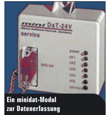
Ein minidat-Modul zur Datenerfassung