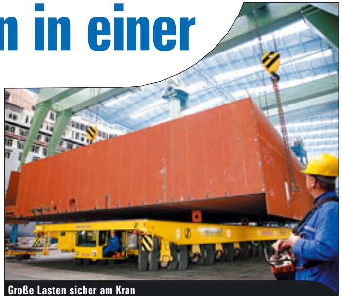
Große Lasten sicher am Kran

In der Meyer Werft Papenburg werden unter anderem Luxus-Kreuzfahrtschiffe von knapp 300 Metern Länge gebaut. Für die entsprechende Logistik sind Krane und deren Steuerungen von Bedeutung.