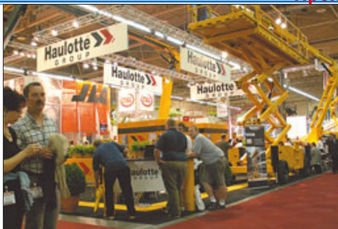
Mit neuen Logo und neuem Namen hat sich Haulotte in Maastricht präsentiert