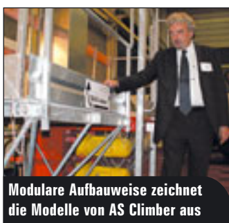
Modulare Aufbauweise zeichnet die Modelle von AS Climber aus

In diesem Jahr ist der deutsche Hersteller PB mit einer