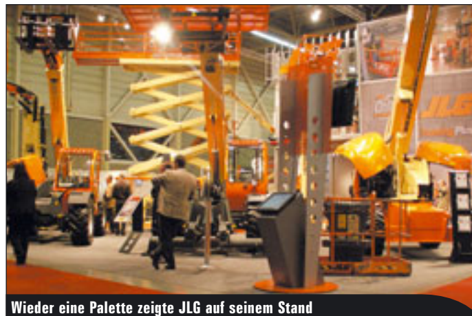
Wieder eine Palette zeigte JLG auf seinem Stand

anderem Geräte mit Kundenwünschen vorgestellt. Für Haulotte war gleich alles neu. Die Chefetage hat gewechselt, das Logo wurde geändert und der Name von vormals Pinguely-Haulotte auf nunmehr Haulotte Group gekürzt. Und als Zugabe gab es sieben neue Modelle. Wurde auf der bauma 2004 noch seitens Haulotte gesagt, dass es derzeit keinen Markt für Teleskopbühnen über 40