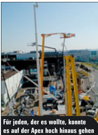
Für jeden, der es wollte, konnte es auf der Apex hoch hinaus gehen

Wie immer dicht gedrängt ging es auf der Freifläche auf der Rückseite der Hallen zu. Den LKW-Bühnenherstellern kam dies mehr als sehr entgegen. Und nicht nur aufgrund des strahlenden Sonnenscheins war das Außenareal ein gern besuchter Ort. De facto jeder hatte etwas Neues im Gepäck. Sei es Ruthmann mit der T 370, Wumags neue TB 220 oder Bisons große TKA 61 KS, ebenso wie Bronto mit seiner S 90 HLA oder Pagliero, das mit der MX200 erstmals eine Gelenkteleskopbühne auf den Markt gebracht hat (Details s. S.20ff). ▶▶