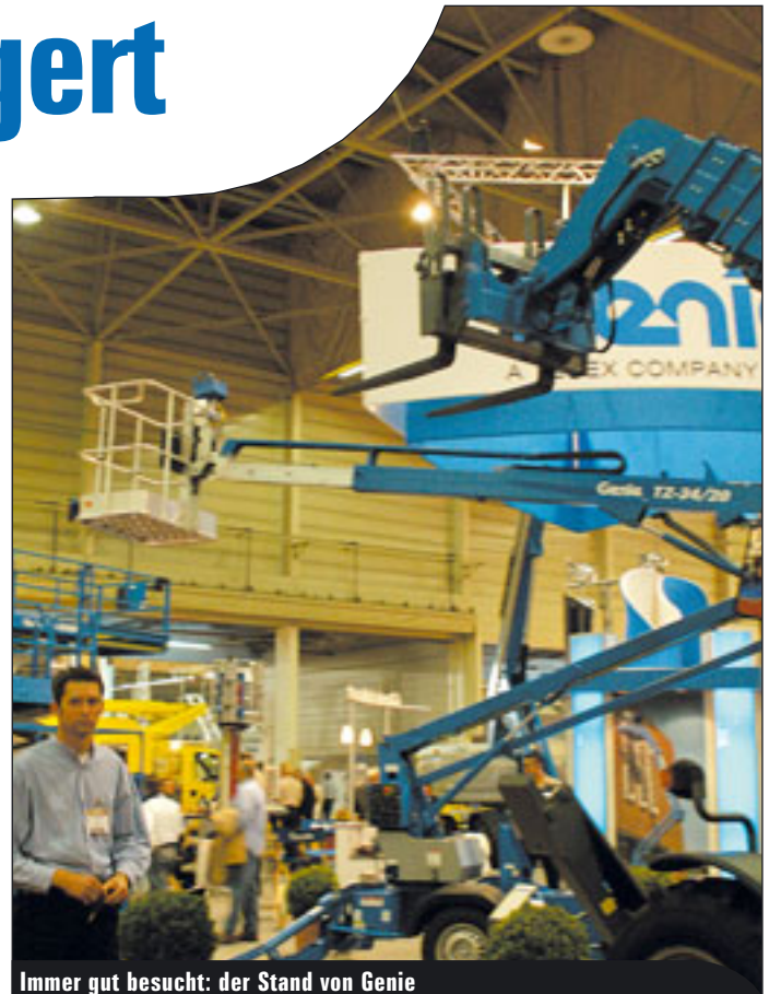
Immer gut besucht: der Stand von Genie