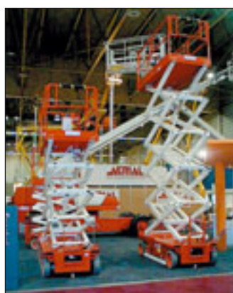
Wieder präsent: Snorkel mit Scheren- und Teleskopbühnen

neuen Reihe an Scherenarbeitsbühnen auf den Markt gekommen. Die Elektroscheren gibt es in zwei Breiten mit 1,2 Metern und 1,6 Metern von 12,1 bis 17 Metern Arbeitshöhe. Dank der nach oben sich verjüngenden Scherenpakete liegt das Gewicht beispielsweise bei der 12-Meter-Variante S121-12 E bei 2880 Kilogramm.