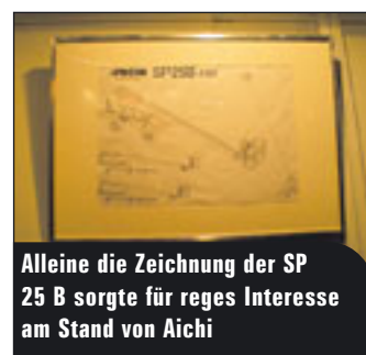
Alleine die Zeichnung der SP 25 B sorgte für reges Interesse am Stand von Aichi

Die Apex ist aber auch ein gutes Pflaster in Sachen Mastklettertechnik. Nicht nur die bekannten Namen, wie Safi oder Fraco und Scanclimber nutzen die Show für sich. Auch Neueinsteiger, wie AS-Climber finden sich hier ein. Mit dem Konzept, die Geräte in allen Fragen modular zu gestalten, will das Unternehmen in diesem Sektor neue Akzente setzen. Durch die Austauschbarkeit kann jeder seine eigene Wunschkombi an Decks, Antrieben und Motoren zusammenstellen, je nachdem, was mehr benötigt wird.