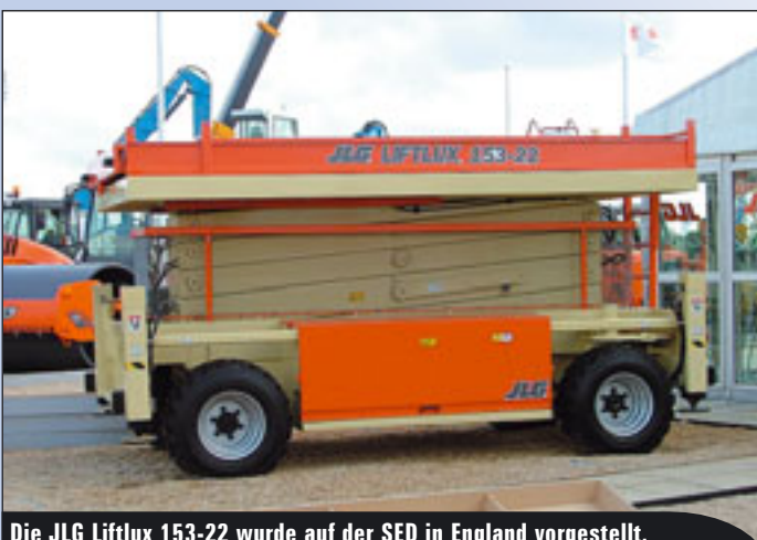
Die JLG Liftlux 153-22 wurde auf der SED in England vorgestellt.