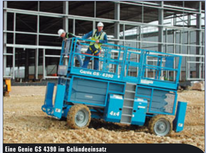
Eine Genie GS 4390 im Geländeeinsatz