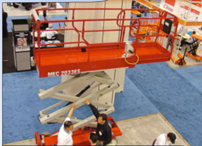
Der Hersteller MEC kommt wieder nach Europa, hier ein Modell, das in Las Vegas auf der Conexpo zu sehen war.