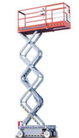
Die Skyjack 3219 ein- und ausgefahren