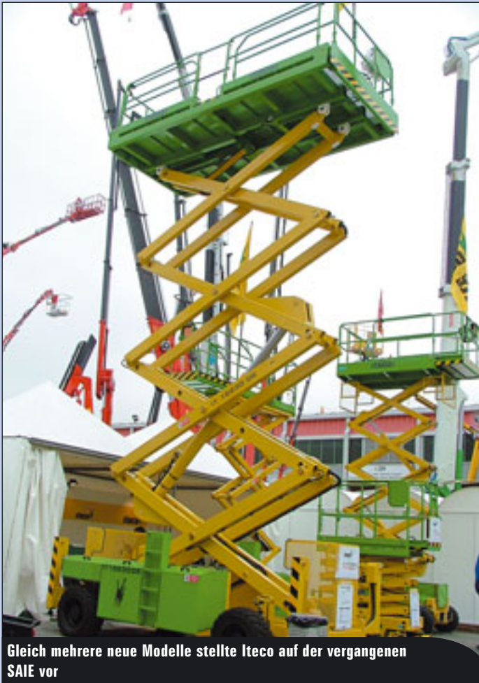
Gleich mehrere neue Modelle stellte Iteco auf der vergangenen SAIE vor