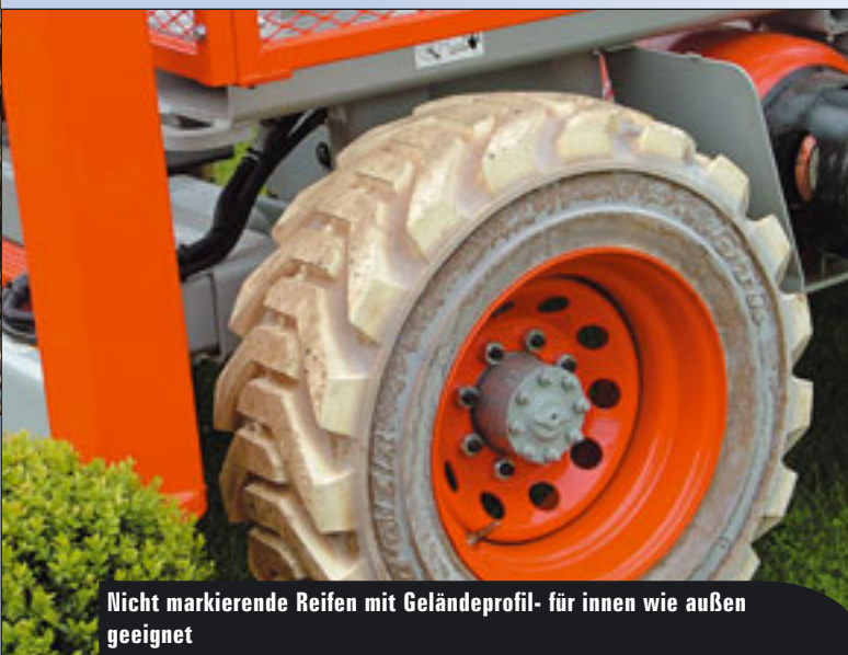
Nicht markierende Reifen mit Geländeprofil- für innen wie außen geeignet