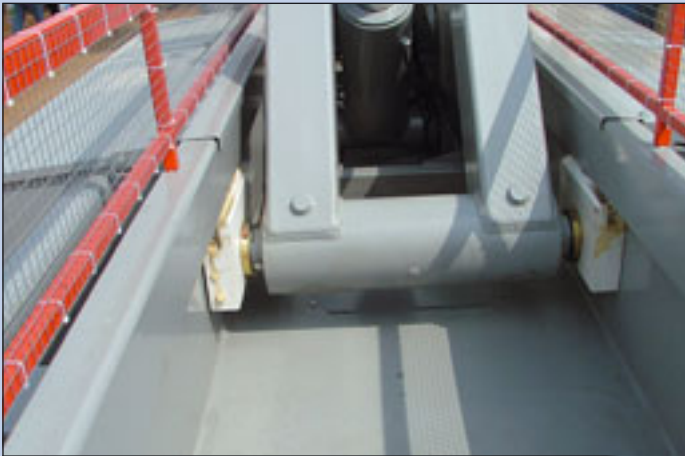
Die gleitende Lagerung des Scherenpakets in Kunststoffblöcken mit Führungsnuten bei Hollandlift