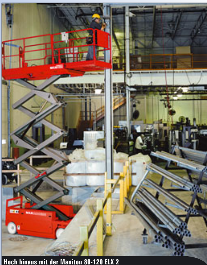
Hoch hinaus mit der Manitou 80-120 ELX 2