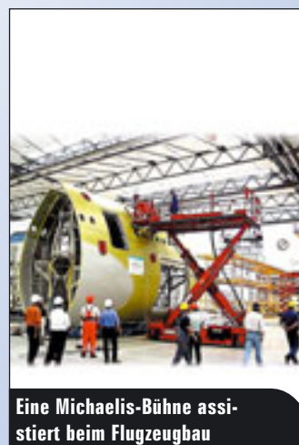
Eine Michaelis-Bühne assistiert beim Flugzeugbau