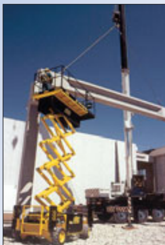
Das Modell SF 1000 des italienischen Herstellers Airo am Gebäude

Gegenüber unserem letzten Beitrag über diese beliebte und gerade im Vermietgeschäft am meisten nachgefragte Gerätegattung hat sich auf dem Sektor „Technische Weiterentwicklungen“ recht wenig getan. Kein Wunder, wenn man bedenkt, dass der betreffende Beitrag (Kran und Bühne Nr. 44 vom Dezember/Januar 05) erst gut ein halbes Jahr zurückliegt. Es gab in der Zwischenzeit durchaus Neuvorstellungen von einzelnen Herstellern - dies beson-