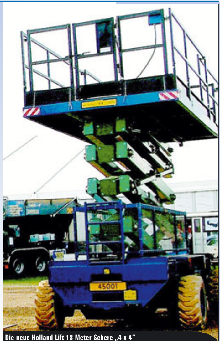
Die neue Holland Lift 18 Meter Schere „4 x 4“

« Antriebssektor tut sich was, Iteco stattet bestimmte Modelle mit Motoren an jedem Antriebsrad aus, was zusammen mit einem großen Einschlagwinkel der Räder für eine bisher unerreichte Beweglichkeit und ein „Wenden auf der Stelle“ sorgt, eine seitliche Verfahrbarkeit auf engstem Raum wird damit realisiert. Montage, Service- und im »