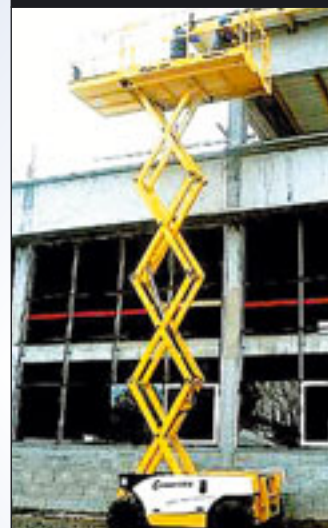
Modell aus der Compact-Reihe von Haulotte voll ausgefahren

ge Hersteller vorgenommen haben und laufend vornehmen, umfassen die gesamte Maschine, von den Reifen, über den sauberen Aufbau der Schränke mit Motoren, Pumpen und Elektrik/Elektronik bis hin zur Lagerung und Bewegung der Scherenpakete. Holland Lift hat zum Beispiel bei seinen neuen Modellen diese Lagerung und Abstützung der Schere auf dem Chassis ganz neu durch robuste Kunststoffblöcke gelöst, in denen die Schere gelagert ist. Auch auf dem ▶▶