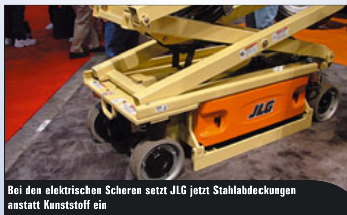
Bei den elektrischen Scheren setzt JLG jetzt Stahlabdeckungen anstatt Kunststoff ein

« Antriebssektor tut sich was, Iteco stattet bestimmte Modelle mit Motoren an jedem Antriebsrad aus, was zusammen mit einem großen Einschlagwinkel der Räder für eine bisher unerreichte Beweglichkeit und ein „Wenden auf der Stelle“ sorgt, eine seitliche Verfahrbarkeit auf engstem Raum wird damit realisiert. Montage, Service- und im »