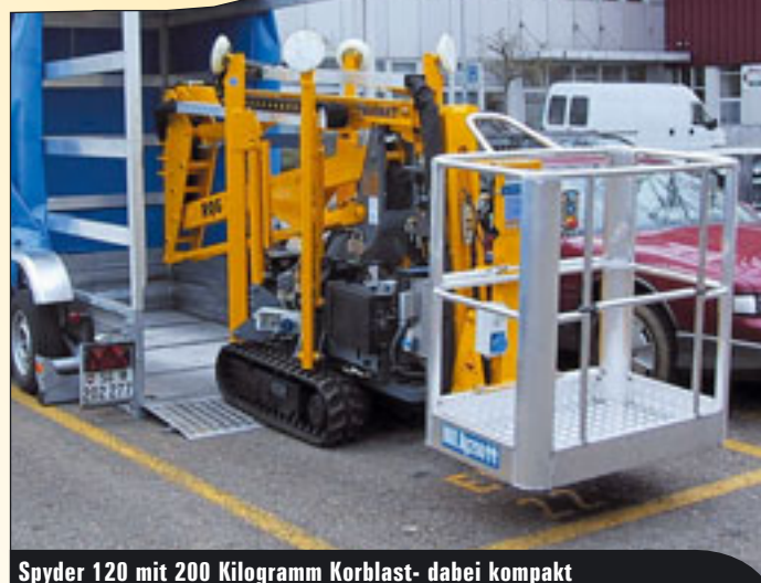
Spyder 120 mit 200 Kilogramm Korblast- dabei kompakt