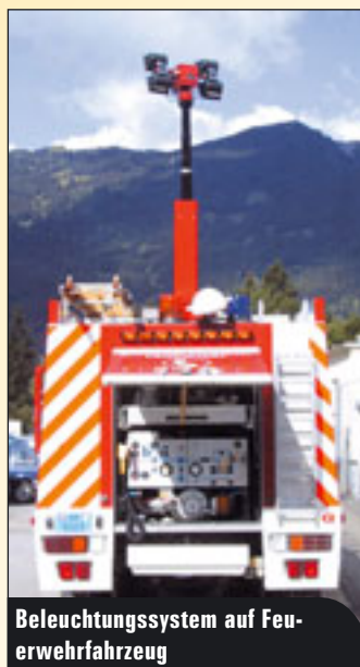
Beleuchtungssystem auf Feuerwehrfahrzeug