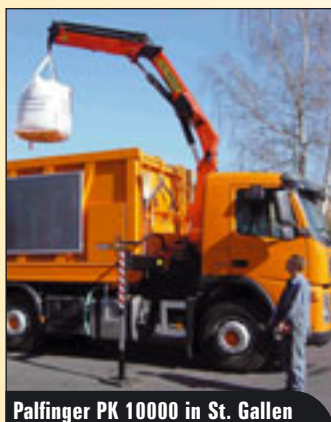
Palfinger PK 10000 in St. Gallen

und Knickarm. Also ideal für Einsätze, wo leichtes Eigengewicht, grosse Reichweiten und Hubkraftreserven vom Kran gefordert werden. Die Modelle der Performance-Reihe zwischen 20 und 29 Metertonnen zeichnen sich aus durch das Doppelkniehebelsystem, den um 15° überstreckbaren Knickarm und ab Modell PK 29002 durch das Endlos-Schwenkwerk mit Kugeldrehkranz. Diese Modelle werden serienmässig auch mit dem von Palfinger entwickelten HPLS System zur Erhöhung der Hubkraft sowie Funkfernsteuerung geliefert.