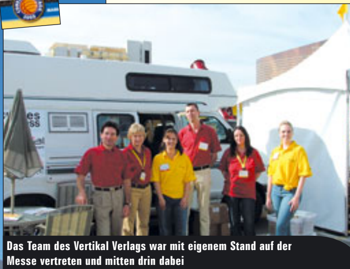
Das Team des Vertikal Verlags war mit eigenem Stand auf der Messe vertreten und mitten drin dabei