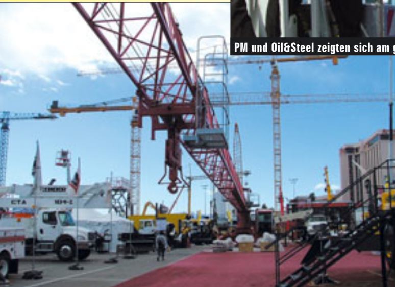
Der 100000tausendste Potain Turmdrehkran wurde an Amquip verkauft

Cranes und fügt an: „Der Markt bei den Turmdrehkränen wächst zur Zeit enorm und wir sind dabei, die Fertigungskapazitäten in den Produktionsstätten in Deutschland, Italien und den USA zu erhöhen, um der Nachfrage gerecht zu werden.“ K & B