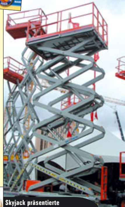
Skyjack präsentierte einen Querschnitt aus seinem aktuellen Scherenprogramm

Cranes und fügt an: „Der Markt bei den Turmdrehkränen wächst zur Zeit enorm und wir sind dabei, die Fertigungskapazitäten in den Produktionsstätten in Deutschland, Italien und den USA zu erhöhen, um der Nachfrage gerecht zu werden.“ K & B