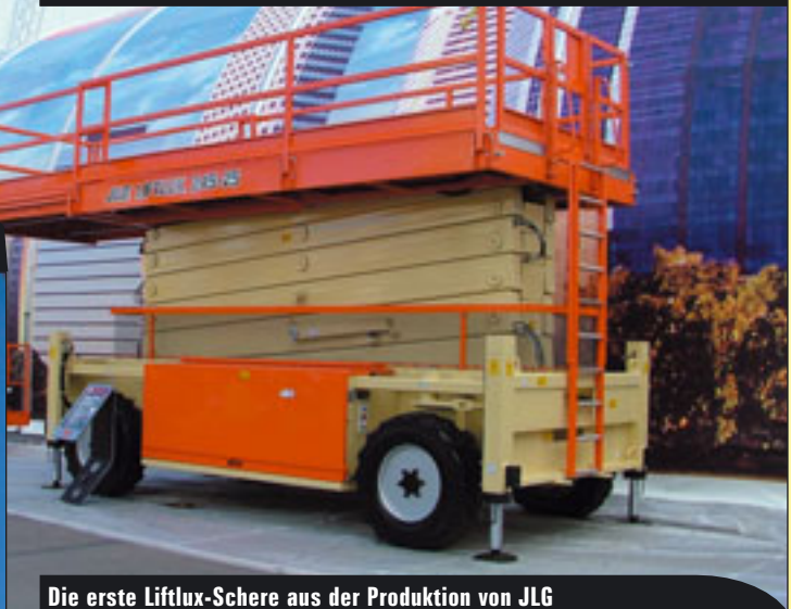
Die erste Liftlux-Schere aus der Produktion von JLG

Amerika, auf den Punkt. Um bei all dem Andrang die Aufmerksamkeit auf sich zu lenken, haben die fast 2000 Aussteller etliche Neuheiten mit im Gepäck gehabt. Sei es Liebherr mit dem LTM 1095-1, die neuen Anhängerbühnen von Snorkel