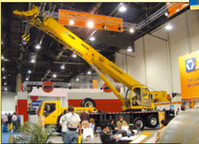
Für eine Überraschung sorgte der chinesische Hersteller XCMG mit seinem 65 Tonner