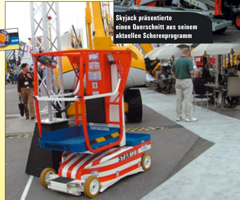
Eine Haulotte Mastbühne mit "Stars and Stripes"