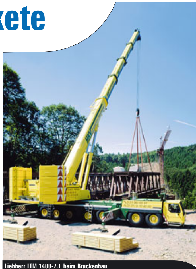
Liebherr LTM 1400-7.1 beim Brückenbau

Von den etwa 500 pro Jahr in Deutschland umgesetzten Mobilkranen entfallen an die 100 Stück auf die Modelle ab fünf Achsen aufwärts. Die Statistik lässt, da sie sich an den reinen Zulassungen für den Straßenverkehr orientiert, keine genauere Aufschlüsselung nach Gewicht- und Tragkraftklassen zu. Es gibt auf dem Markt zum Beispiel 100 – Tonner sowohl mit vier als auch mit fünf Achsen. Allgemein kann man aber davon ausgehen, dass fünfachsiges Ausführungen sich normalerweise im Bereich ab 150/160 Tonnen und mehr bewegen. Welches Modell mit welcher Tragkraft im Speziellen eingesetzt wird, hängt nicht nur vom zu hebenden Objekt ab, sondern auch davon, wie die äußeren Bedingungen sind. Wenn eine enge Baustelle anzufahren und zu bedienen ist, wird, wo es von der geforderten Tragkraft her irgend möglich ist, eher ein Modell mit weniger Achsen zum Einsatz kommen. Denn trotz Allradlenkung und engsten möglichen Radien bedeutet jede weitere Achse auch mehr Fahrzeuglänge und damit weniger Wendigkeit und Manövrierfähigkeit. Auch die Möglichkeit beziehungsweise Notwendigkeit, zusätzlichen Ballast entweder auf dem Mobilkran selbst oder eben auf einem Hilfsfahr-