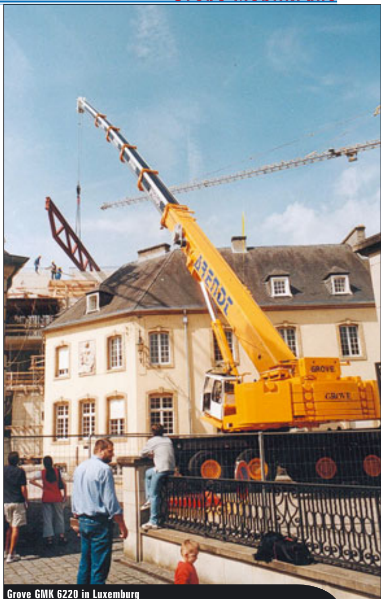
Grove GMK 6220 in Luxemburg

Weitere technische Leckerbissen sind die integrierte Schwerlastspitze mit 33,5 Tonnen Traglast sowie der in diesem Modell serienmässig eingebaute „lift adjuster“, eine Einrichtung, die das gefürchtete Schwingen und Pendeln der Last direkt nach dem Anheben, das durch die Durchbiegung des Auslegers verursacht wird, verhindert. Das System ist in das Lastmomentbegrenzungsprogramm integriert und berechnet die zu erwartende Vergrößerung des Arbeitsradius. Dabei werden Auslegerlänge und -winkel sowie das Gewicht der Last berücksichtigt. Dann wird computergesteu-