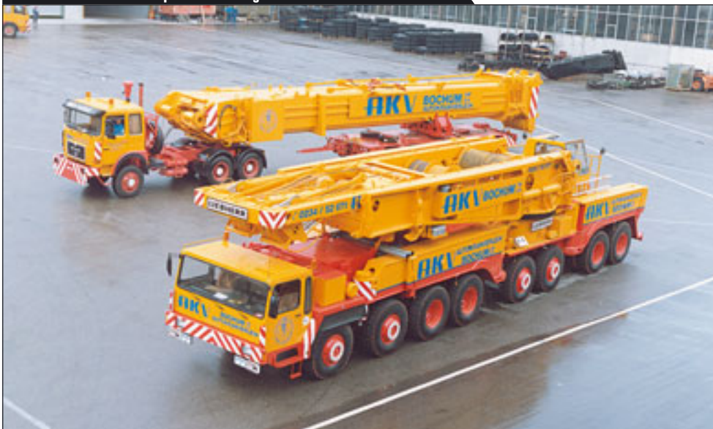
Liebherr LTM 1800 mit separatem Ausleger

Grove bietet vier Modelle zwischen 200 und 450 Tonnen Tragkraft sowie 60 bis 70 Meter Auslegerlänge an. Dabei ist vom „Flaggschiff“, dem GMK 7450 mit seinen sieben Achsen, 126 Metern Spitzenhöhe und 73 Metern Auslegerlänge, derzeit kein