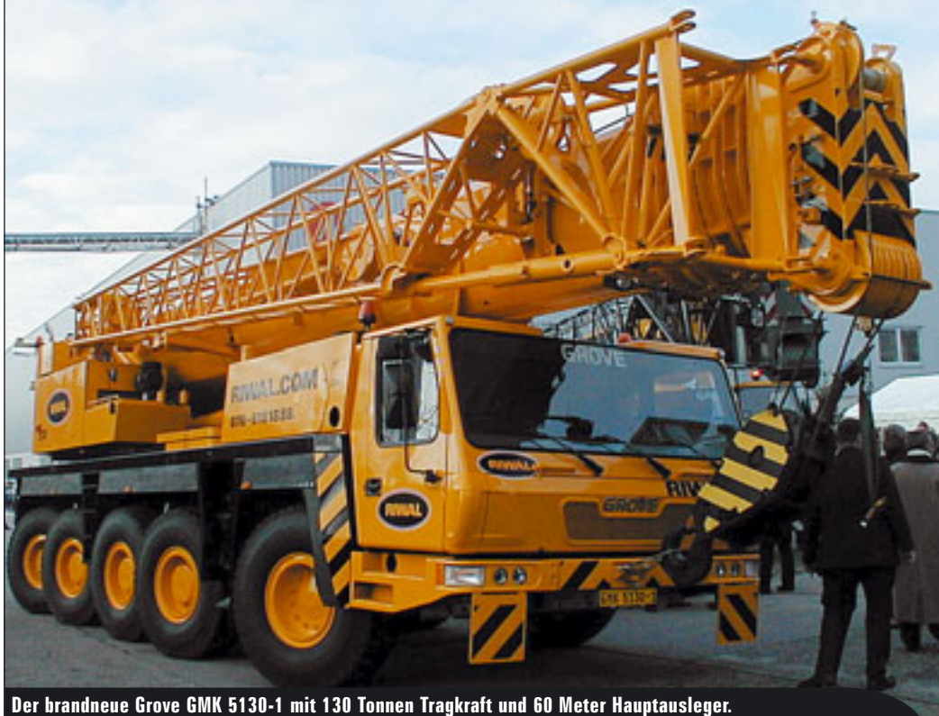
Der brandneue Grove GMK 5130-1 mit 130 Tonnen Tragkraft und 60 Meter Hauptausleger.

◀ seitliche Superlift- Einrichtung sorgt hier für eine gesteigerte Tragkraft von 700 Tonnen bei 3 Metern Ausladung. Die maximale Auslegerlänge beträgt 145,5 Meter, die gesamte Transportlänge 20,6 Meter. Der Unterwagenmotor leistet 420 kW /571 PS und erlaubt so eine maximale Geschwindigkeit auf der Straße von 63 km/h. Für die Kranfunktionen ist ein Oberwagenmotor mit 205 kW/279 PS eingebaut.