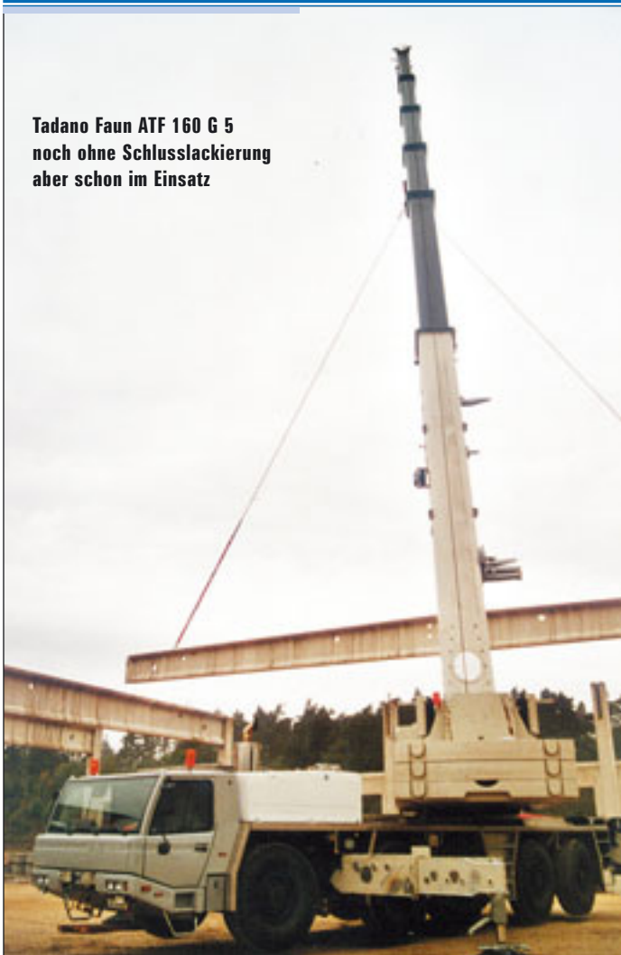
Tadano Faun ATF 160 G 5 noch ohne Schlusslackierung aber schon im Einsatz

drehkrane vorbei gehoben werden mussten. Diese Konstruktionsteile kamen per Spezialtransporter auf die Baustelle, um dann bis in rund 25 Meter Höhe mit einer Ausladung von 35 Metern gehoben zu werden.