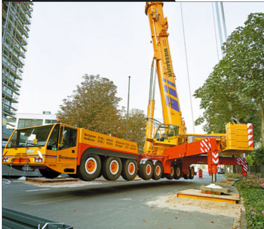
Terex Demag AC 650- 1 in den Farben von Wiesbauer