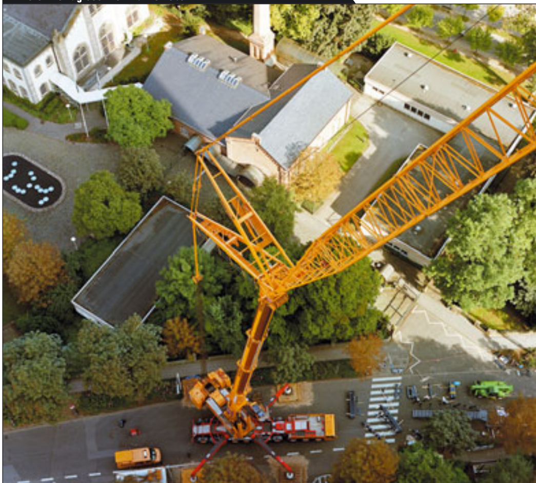
Ein Terex-Demag 650-1 einmal von oben

Der weltweit erste Einsatz dieses Modells fand in Echternach/ Luxemburg statt, wo für ein Kulturzentrum in der mittelalterlichen Altstadt jeweils 15 Tonnen wiegende Dachbinder aus Stahl über Gebäude hinweg und neben zwei Turm-