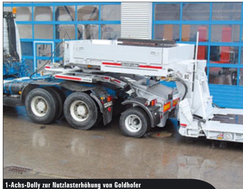
1-Achs-Dolly zur Nutzlastserhöhung von Goldhofer

Öffentlichkeit präsentiert. Aber auch LKW-Bühnen-Hersteller zeigten hier ihre Jahresneuheiten.