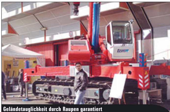
Geländetauglichkeit durch Raupen garantiert

Schnelleinsatzkrane mit Raupenunterwagen ergänzen das Programm zur SAIE. Itecolift (Freigelände A 44, Stand B 32) zeigt das neue Scherenbühnen-Modell IT 4080, das sich neben neuer „Re-style“ Optik vor allem durch Gewichtsreduzierung auszeichnet, es kann mit einem 3,5-Tonner an den Einsatzort transportiert werden. Weitere Daten: Arbeitshöhe 9,10 Meter, Breite 0,8 Meter, Länge 1,8 Meter sowie Bühnenkapazität 230 Kilogramm. ▶▶