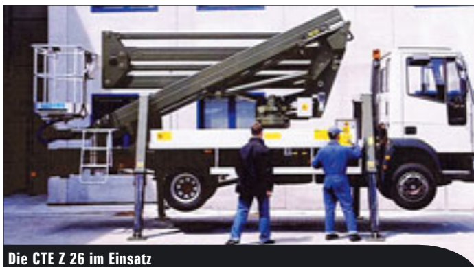
Die CTE Z 26 im Einsatz

◀ Effer bringt neue Ladekranausführungen mit, den 110 E-115 (11 mt) und den 1550-J-Power 6S (114 mt). Besonderheit laut Hersteller: die vollelektronische Kontrollbox, genannt „Data Monitor Unit“ (Freigelände A 44 S, Stand D 38).