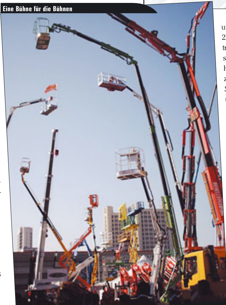
Eine Bühne für die Bühnen

Fassi zum Beispiel stellt gleich drei neue Modelle in Bologna vor, den F170B, F190B