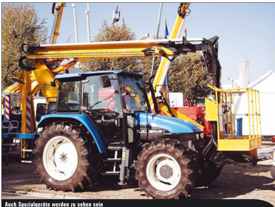
Auch Spezialgeräte werden zu sehen sein

◀◀ Mobilbaukran MK 100 erweitert diese Baureihe nach oben. Mit seinem Fünffachschassis verfügt er über eine Auslegerlänge von 52 Metern – wie seine „kleineren Brüder“ für die Ein-Mann-Montage konzipiert. Erstmals kommt hier bei einem Mobilbaukran ein vierteiliger, teleskopierbarer Ausleger in Gitterkonstruktion zum Einsatz. Als Innovation bei den Schnelleinsatzkranen vorgestellt werden der 32H, der diese Baureihe nach oben abrundet, sowie der 42K.1, dessen Gesamtleistung nach Überarbeitung in den Bereichen Aufstell-Kinematik, Montagehandling, Auslegermontage und der Antriebe sich deutlich verbessert präsentiert. Neue Obendreherkranmodelle und