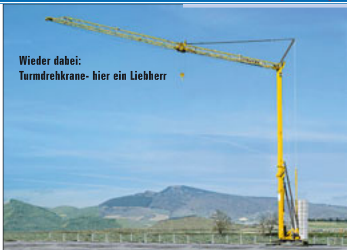
Wieder dabei: Turmdrehkrane- hier ein Liebherr

Schnelleinsatzkrane mit Raupenunterwagen ergänzen das Programm zur SAIE. Itecolift (Freigelände A 44, Stand B 32) zeigt das neue Scherenbühnen-Modell IT 4080, das sich neben neuer „Re-style“ Optik vor allem durch Gewichtsreduzierung auszeichnet, es kann mit einem 3,5-Tonner an den Einsatzort transportiert werden. Weitere Daten: Arbeitshöhe 9,10 Meter, Breite 0,8 Meter, Länge 1,8 Meter sowie Bühnenkapazität 230 Kilogramm. ▶▶