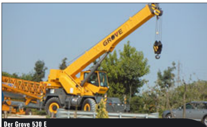
Der Grove 530 E

Ebenfalls einen 5-Achser präsentiert Terex-Demag mit dem Topmodell AC 120-1, ein Mobilkran mit 120 Tonnen Hubkraft mit 2,75 Metern Unterwagenbreite und geschwindigkeitsabhängiger Hinterachslenkung. Wie weit die Steuerung heute auf Elektronik baut, zeigt die IC-1 genannte Steuerung mit Touchscreen-Bedienung.