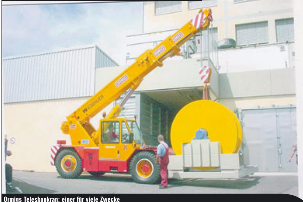
Ormigs Teleskopkran: einer für viele Zwecke

Seine Gelenkbühnenreihe nach oben erweitert CTE mit der Z 26-nach 20 Metern Arbeitshöhe sind durch die neue Ausführung 26 Meter Arbeitshöhe erreichbar, was der kompakten Aufbaubühne ganz neue Einsatzmöglichkeiten erschließt. Als international tätige Hersteller sind neben den schon erwähnten auch JLG, Genie und Haulotte mit einem umfangreichen Produktprogramm in Bologna vertreten, sicher ein weiterer guter Grund, der SAIE einen Besuch abzustatten. K&B