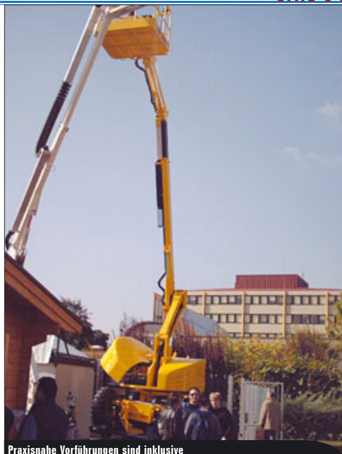
Praxisnahe Vorführungen sind inklusive

Ebenfalls im Freigelände (A 48, Stand C 39- E 40) stellt Manitowoc seine Neuheiten vor, unter anderem den Potain Turmkran „City“ MDT 98 mit sechs Tonnen Hubkraft. Eine „Vision“ genannte Krankabine soll den heute möglichen hohen Standard von Ergonomie und technischen Möglichkeiten demonstrieren. Weiter ist der neue Grove 5-Achs-Mobilkran GMK5130-1 mit 130 Tonnen Kapazität zu sehen.