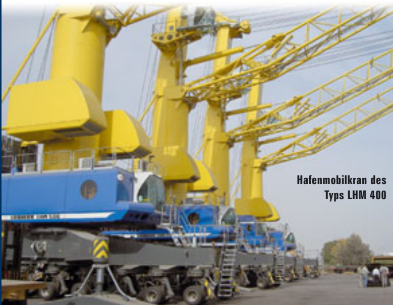
Hafemobilkran des Typs LHM 400