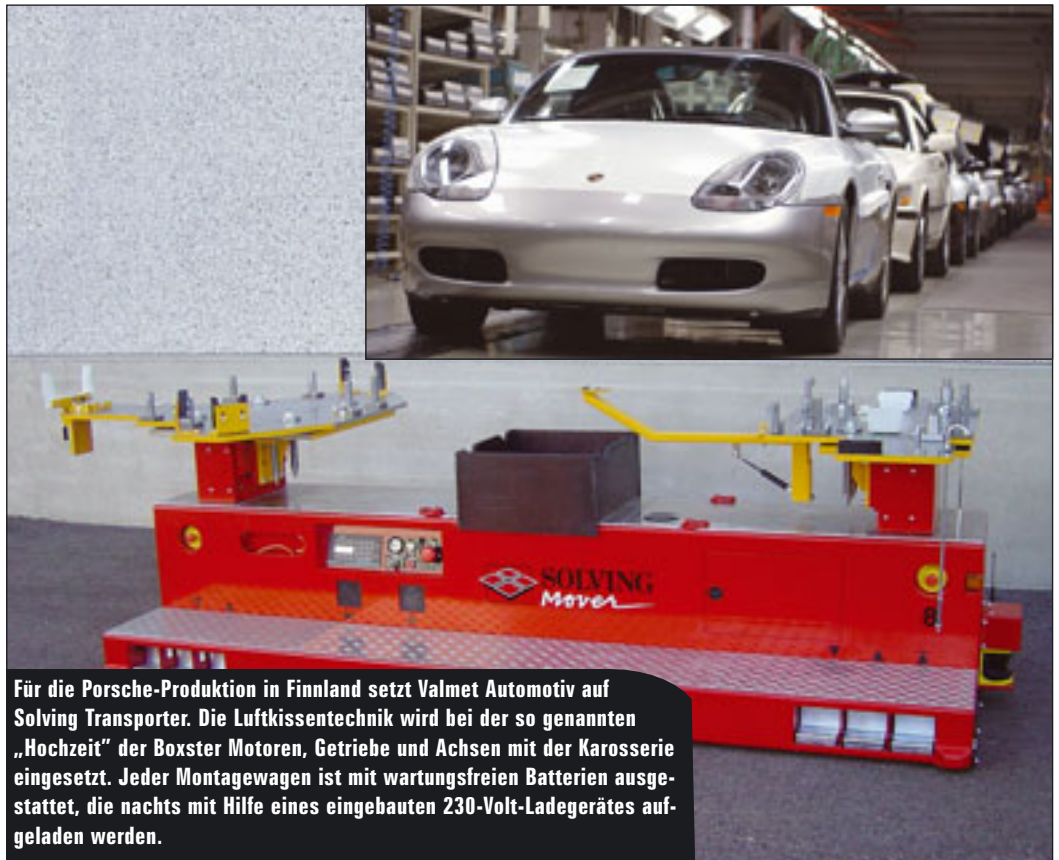
Für die Porsche-Produktion in Finnland setzt Valmet Automotiv auf Solving Transporter. Die Luftkissentech- nik wird bei der so genannten „Hochzeit“ der Boxster Motoren, Getriebe und Achsen mit der Karosserie eingesetzt. Jeder Montagewagen ist mit wartungsfreien Batterien aus- gestattet, die nachts mit Hilfe eines eingebauten 230-Volt-Ladegerätes auf- geladen werden.

Dieses Verfahren der Last vom Tieflader zum Einbauort oder umgekehrt birgt einen entscheidenden Zeitvorteil. Gilt es auf dem Weg weiteren Hindernissen auszuweichen und ist die Last nicht zu schwer, stehen eine Reihe von Maschinenvarianten inzwischen zur Verfügung. Schwerere Lasten bis in den Bereich von 10, 20 und mehr Tonnen erledigen Elektromobilkrane durchaus ohne Probleme. Sei es alleine oder