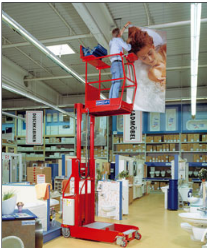
Mit dem Kuli Lift KBE 5 bietet Kuli Hebezeuge einen Personenlift für einfache Arbeiten innerhalb von Gebäuden an. Mit bis zu fünf Metern Arbeitshöhe kommt die Bühne – wie in diesem Baumarkt – in geschlosse- nen teilweisen engen Räumen zum Einsatz. Trotz eingebauten Elektroan- trieb bringt das Gerät nur 680 Kilogramm auf die Waage und kann so mit einem normalen Aufzug auf verschiedene Etagen gebracht werden.