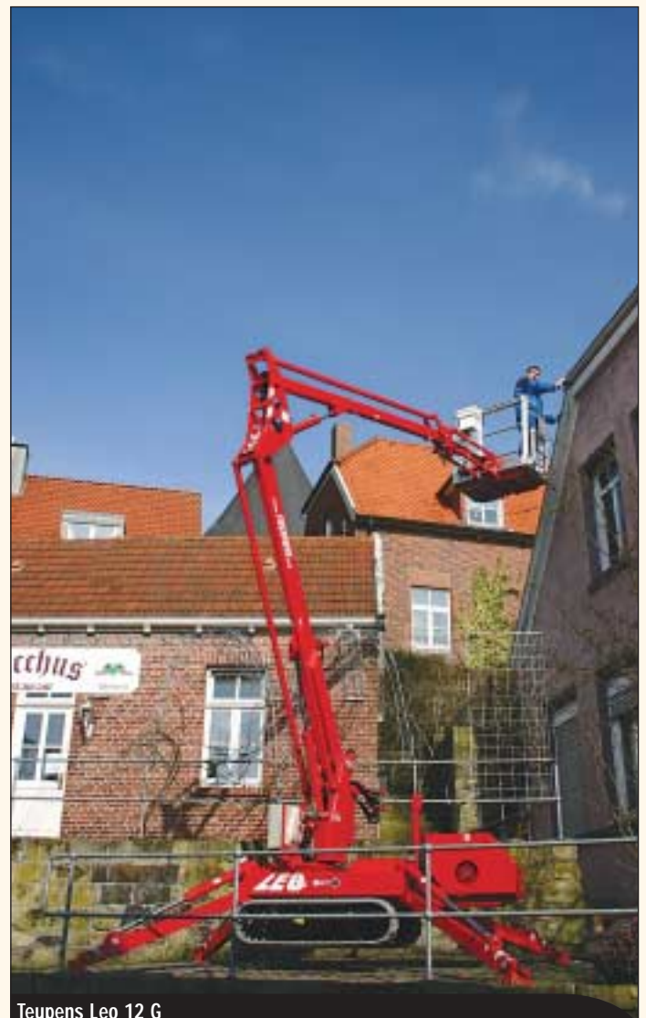
Teupens Leo 12 G

Böcker zeigt unter anderem den neuen AK 41/6000 SPS. Hervorstechendes Merkmal des Alu-Autokrans: die Nutzlast von bis zu sechs Tonnen und eine maximale Höhe von