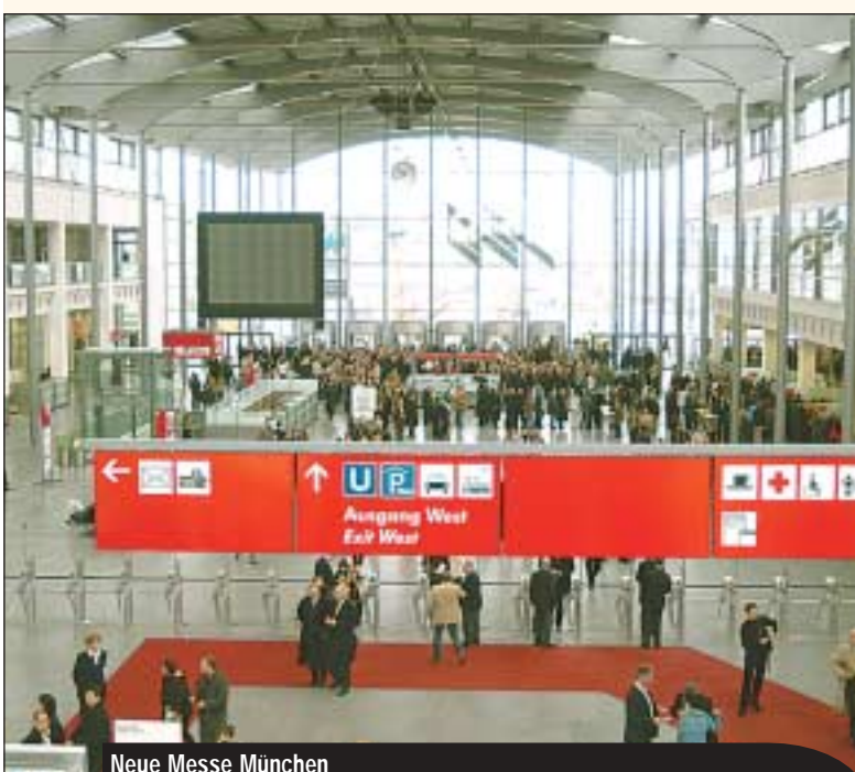
Neue Messe München