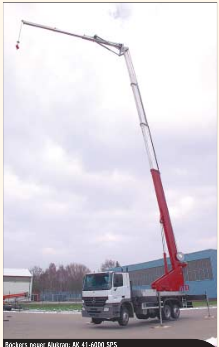
Böckers neuer Alukran: AK 41-6000 SPS