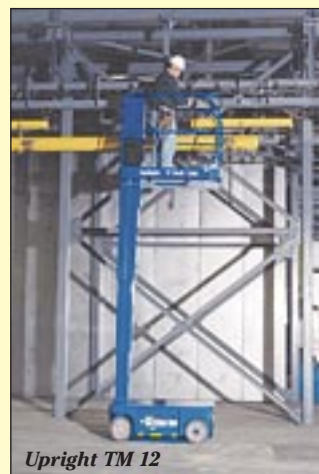
UpRight TM 12

Premiere feiert die Anhänger-Arbeitsbühne TL50 mit 17,2 Metern maximaler Arbeitshöhe. UpRight zeigt weiterhin zwei neue Teleskopbühnen mit 12,20 und 14 Meter Arbeitshöhe. Mit dabei auch der Personenlift TM 12 mit 5,6 Metern Arbeitshöhe und eine Auswahl an Scherenbühnen. UpRight setzt dieses Jahr den Fokus besonders auf den Service.