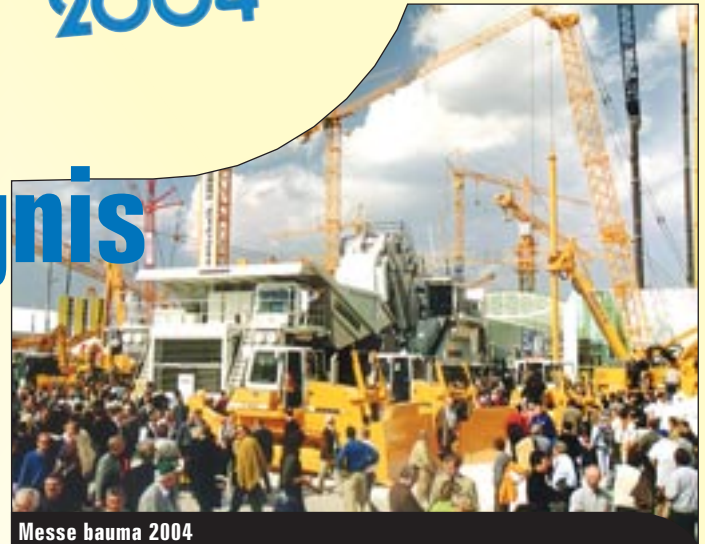
Messe bauma 2004