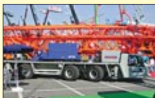
Arcomet ATF 38

Der belgische Kranhersteller präsentiert seinen neuen ATF 38 Turmdrehkran auf einem Tadano Faun Fahrge- stell.