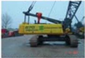
SENNEBOGEN 670 R YEAR 1996