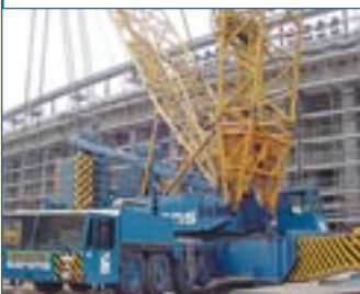
Der TC 3200 SL von Sarens beim Einsatz im Olympia-Stadion Berlin