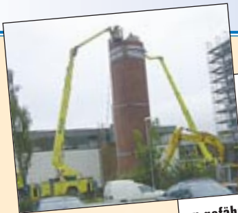
Ein 32 Meter hoher Industriekamin musste im badischen Bühl manuell demontiert werden, da eine Sprengung aufgrund der umliegenden Gebäude zu gefährlich war. Für die Arbeiten setzte Butsch Mietservice, Mitglied von System Lift, eine Bronto S 34 MDT und eine Wumag WT 300 E ein.