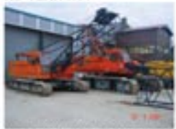
HITACHI KH 180-2 YEAR 1982

ADRIGHEM & BARNHOORN (VMT) BV „MEMBER OF THE ZWAGERMAN GROUP“