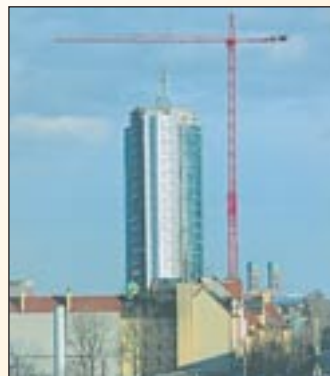
Bei dem Bau des 125 Meter hohen „Munich City Tower“ kam unter anderem ein Wolff 6522 SL Katzausleger aus dem Mietpark von MAN Wolff zum Einsatz. Gefragt war dabei ein Obendreher, der die Baustelle freistehend beliefern konnte. Der Kran mit 55 Meter Ausladung und 3,3 Tonnen Spitzentraglast stand auf eine zwölf mal zwölf Meter Fundamentplatte. In drei Schritten wurde der Kran mit zehn Turmstücken auf seine endgültige Höhe von einer 105 Meter geklettert.

Mehr Vermieter unter www.Vertikal.net/Vermieter