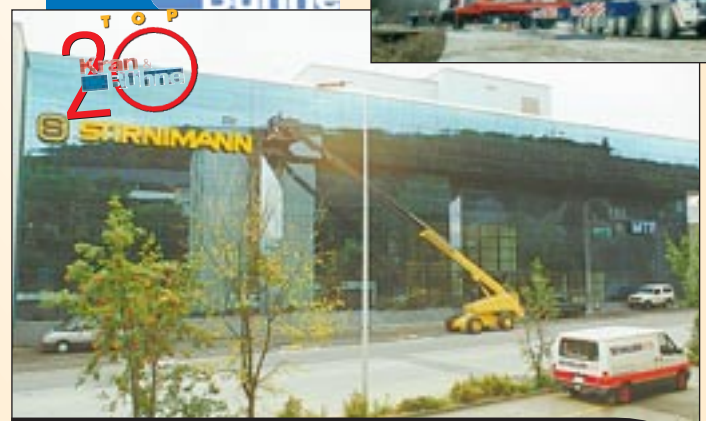
Über 100 Hubarbeitsbühnen vermarktet das Unternehmen Stirnemann in der Schweiz

Die aufgelisteten Daten sind unter aktiver Mithilfe der genannten Unternehmen entstanden. Sollte Ihr Unternehmen Ihrer Meinung nach auch zu dieser Liste gehören, sagen Sie uns Bescheid oder schicken Sie uns ihre Daten. Wir informieren unsere Leser gerne.