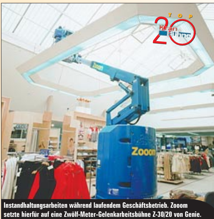
Instandhaltungsarbeiten während laufendem Geschäftsbetrieb. Zoomon setzte hierfür auf eine Zwölf-Meter-Gelenkarbeitsbühne Z-30/20 von Genie.

Für das laufende Jahr erwartet er, dass es sicherlich härter wird wie 2002. „Und das Kommende wird sicherlich auch nicht besser.“ Eine Marktberingung scheint für ihn die logische Konsequenz.