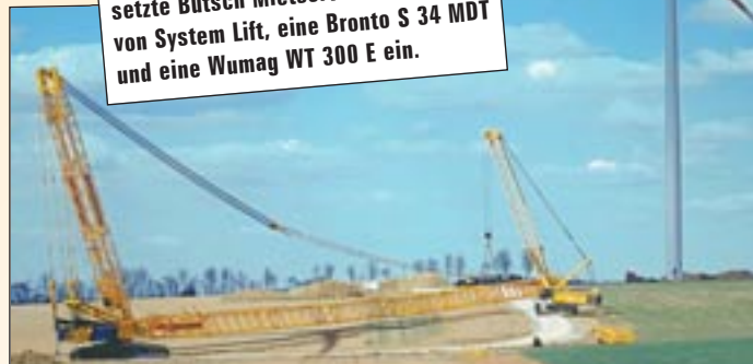
Ein Liebherr LR 1130 nutzt das Oldenburger Unternehmen Ulferts & Wittrock im Bereich des Windanlagenbaus, um den Ausleger des größeren LR 1400/2 von einem Einsatzort zum nächsten zu transportieren. Für Rolf Diebel, Betriebsleiter des Unternehmens war vor allem der Sicherheitsaspekt wichtig. Ein Umstürzen des Krans wird somit vermieden und das Umsetzen dauert nur wenige Stunden.