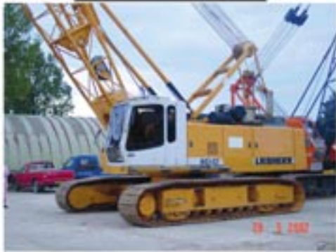
LIEBHERR HS 843 HD YEAR 1997