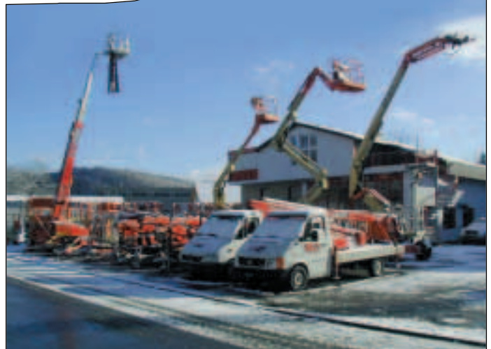
Zum Hauptsitz in Giebenach bei Basel hat SkyAccess ein weiteres Depot in Pratteln auf dem gleichen Gelände wie CATRent eröffnet

ger nicht unbedingt unbekannt. „In den letzten drei Jahrzehnten gab es schon drei oder vier Einbrüche“, sagt aber auch, dass jene nie so stark wie dieser gewesen seien.