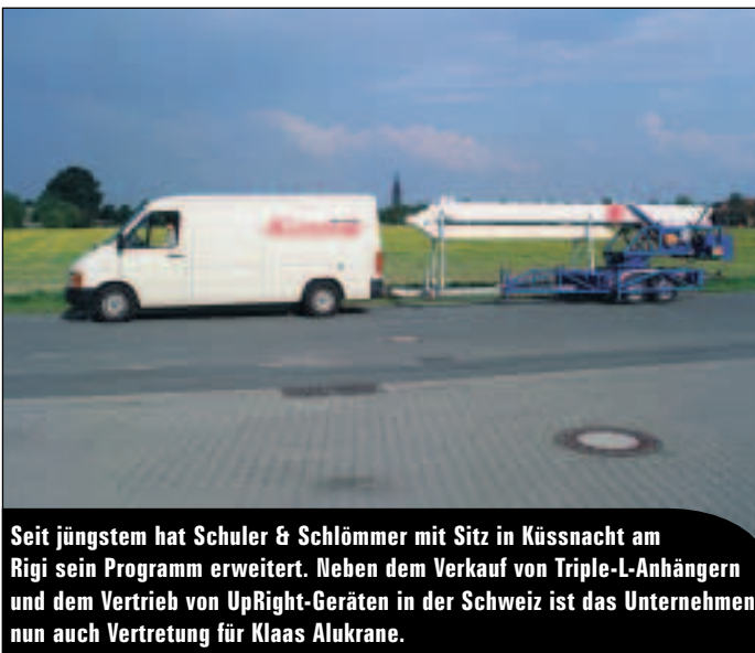
Seit jüngstem hat Schuler & Schlömer mit Sitz in Küssnacht am Rigi sein Programm erweitert. Neben dem Verkauf von Triple-L-Anhängern und dem Vertrieb von UpRight-Geräten in der Schweiz ist das Unternehmen nun auch Vertretung für Klaas Alukrane.