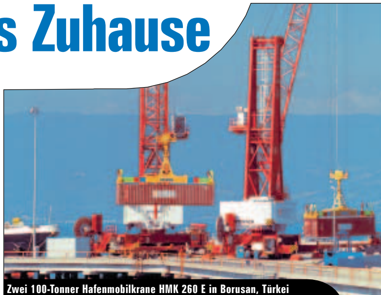
Zwei 100-Tonner Hafemobilkrane HMK 260 E in Borusan, Türkei

Das Hauptstandbein des Unternehmens sind die Hafemobilkrane der Bau-