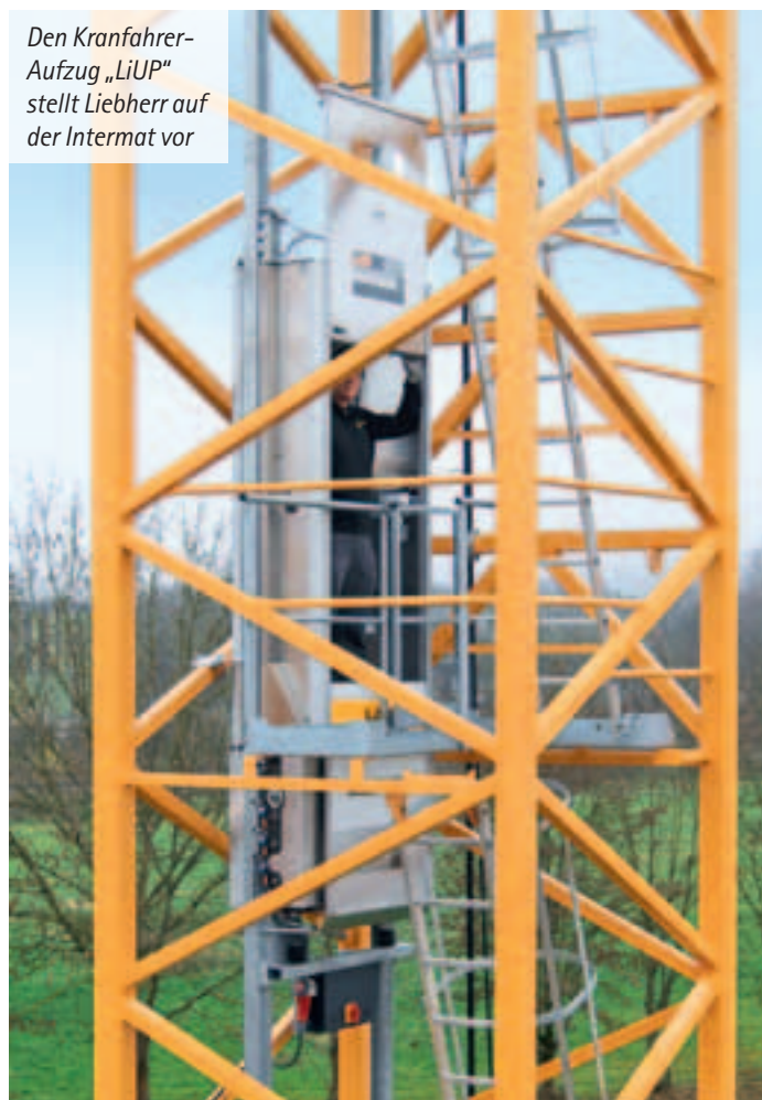
Den Kranfahreraufzug „LiUP“ stellt Liebherr auf der Intermat vor