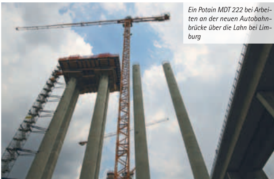
Ein Potain MDT 222 bei Arbeiten an der neuen Autobahnbrücke über die Lahn bei Limburg