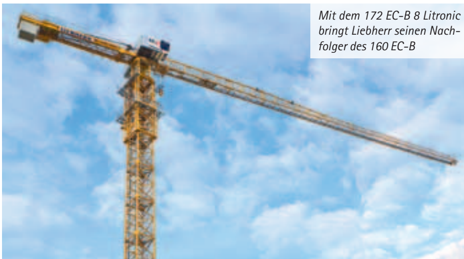
Mit dem 172 EC-B 8 Litronic bringt Liebherr seinen Nachfolger des 160 EC-B