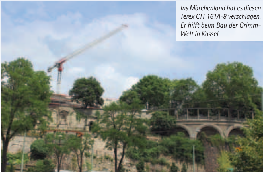
Ins Märchenland hat es diesen Terex CTT 161A-8 verschlagen. Er hilft beim Bau der Grimm-Welt in Kassel

te drei MDT 222 mit Höhen von bis zu 76,2 Meter und 60 Meter Ausladung im Einsatz. Unterstützt wurden die Krane von einem Potain MD 150 sowie einem Potain MD 235 J12. Eine neue Autobahnbrücke über die Lahn ist hier im Entstehen.