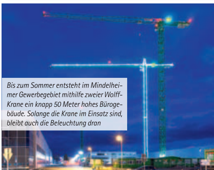
Bis zum Sommer entsteht im Mindelheimer Gewerbegebiet mithilfe zweier Wolff-Krane ein knapp 50 Meter hohes Bürogebäude. Solange die Krane im Einsatz sind, bleibt auch die Beleuchtung dran