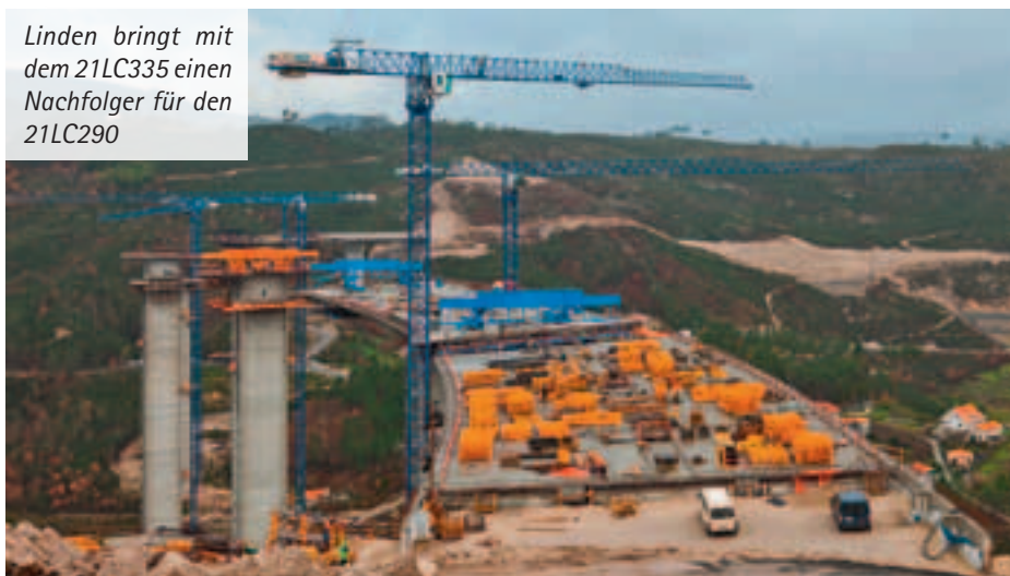
Linden bringt mit dem 21LC335 einen Nachfolger für den 21LC290