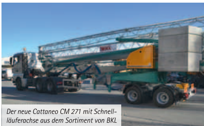
Der neue Cattaneo CM 271 mit Schnellläuferachse aus dem Sortiment von BKL

Bei den Spitzenlosen hat Ende letzten Jahres Potain nachgelegt. So wurde zum einen der MCT 85 vorgestellt. Der Nachfolger des MCi 85 – dieser war für mehr als zehn Jahre Potains Bestseller Nr. 1 – verfügt über eine maximale Auslegerlänge von 52 Metern und eine maximale Hakenhöhe von 44,6 Metern. Er hebt bei 50 Meter Ausladung 1,4 Tonnen. Als Höchstlast an der Auslegerspitze hebt der MCT 85 noch 1,1 Tonnen. Zum anderen wurde der MCT 205 aus der Taufe gehoben. Der Flat-Top-Kran vereint 65 Meter maximale Auslegerlänge sowie eine Spitzenlast von 1,75 Tonnen auf sich. >>