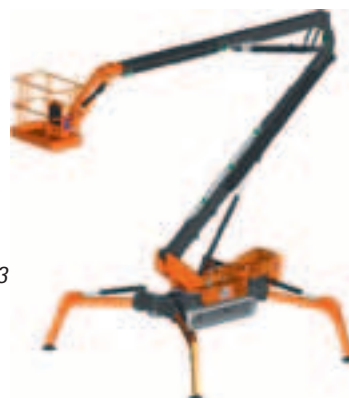
ATN Mygale 23