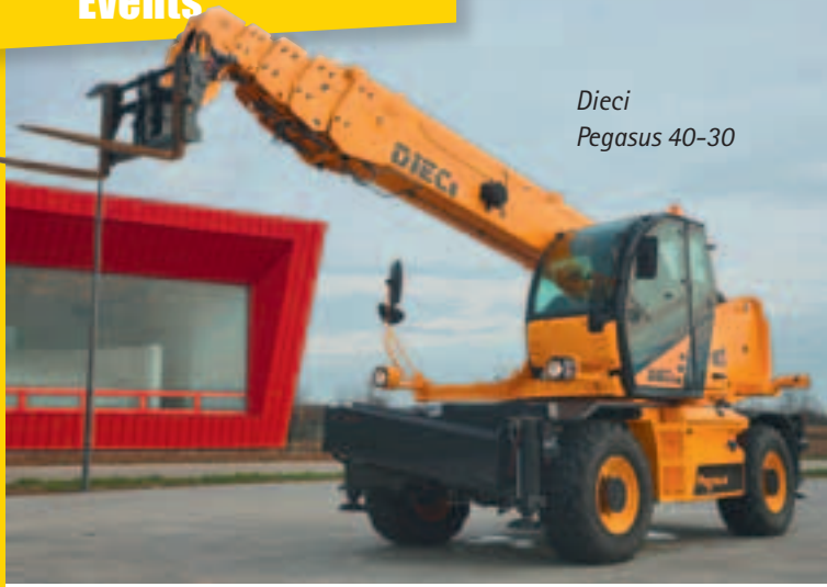
Dieci Pegasus 40-30

3,5 Tonnen Tragkraft und mit Hubhöhen zwischen 12,5 und knapp 14 Metern sind vor allem für das Vermietgeschäft konzipiert. Dabei hat Bobcat in den vergangenen 18 Monaten bereits neue Telesapler mit 10, 12, 14 und 18 Metern Hubhöhe herausgebracht. Designtechnisch sind die neuen Modelle T35130S und T35140S – das „S“ steht für Stabilisatoren – schlicht gehalten. Sie sind ausgestattet mit neuer Kabine und neuem Armaturenbrett mit Digitaldisplay und Joystick. Ebenso gezeigt wird der kleinere TL358, der maximal zwischen 2,6 und drei Tonnen wuppt. Seine maximale Hubhöhe beträgt 5,8 Meter.