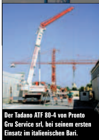
Der Tadano ATF 80-4 von Pronto Gru Service srl, bei seinem ersten Einsatz im italienischen Bari.