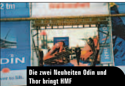
Die zwei Neuheiten Odin und Thor bringt HMF

Und in diesem Jahr werden wieder Turmdrehkrane das Bild ergänzen. Der Besucher wird einen Wald von Türmen in allen Formen und Größen erwarten können. Italienische Ingenieure sind durchaus für ihren Einfallsreichtum bekannt und diejenigen, die Turmdrehkrane weiter entwickeln bilden hierbei keine Ausnahme. So