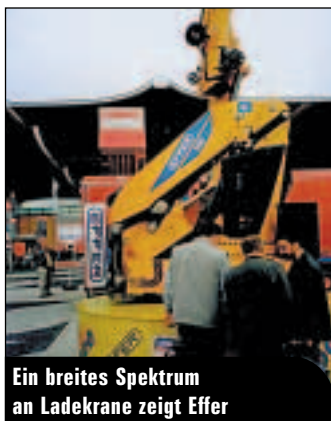
Ein breites Spektrum an Ladekrane zeigt Effer

Während der Messe finden zudem etliche Informationsveranstaltungen statt. Im Mittelpunkt stehen dabei neben der Konjunktur, neue Bautechniken und Belange rund um Sicherheit. Die erste Veranstaltung ist bereits am Dienstag, den