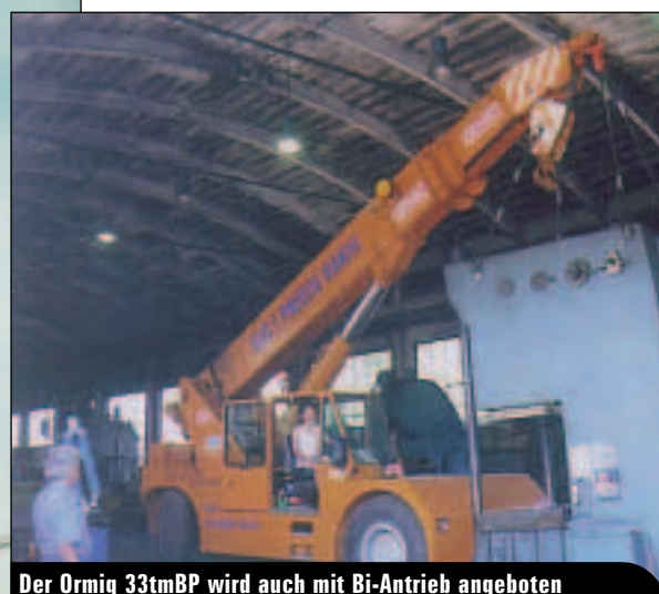
Der Ormig 33tmBP wird auch mit Bi-Antrieb angeboten

Ambiente und der historische Stadtkern von Bologna bieten einen Rahmen, wo sich der Einzelne von der Flut der Eindrücke der Messe in kurzer Zeit erholen kann. Von Keramik bis zu Kranen und von Terrassen bis zu Arbeitsbühnen – die rund 1500 Aussteller lassen die SAIE zu einer wirklich sehr beeindruckenden Messe werden.