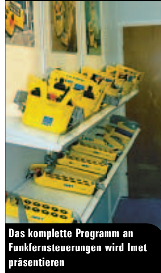
Das komplette Programm an Funkfernsteuerungen wird Imet präsentieren

die Messe, um das komplette Programm an Funkfernsteuerungen zu zeigen. Die Anwendungsbereiche reichen dabei von Hallenkränen, Turmdrehkränen über verschiedene Baumaschinen bis hin zu Ladekranen.