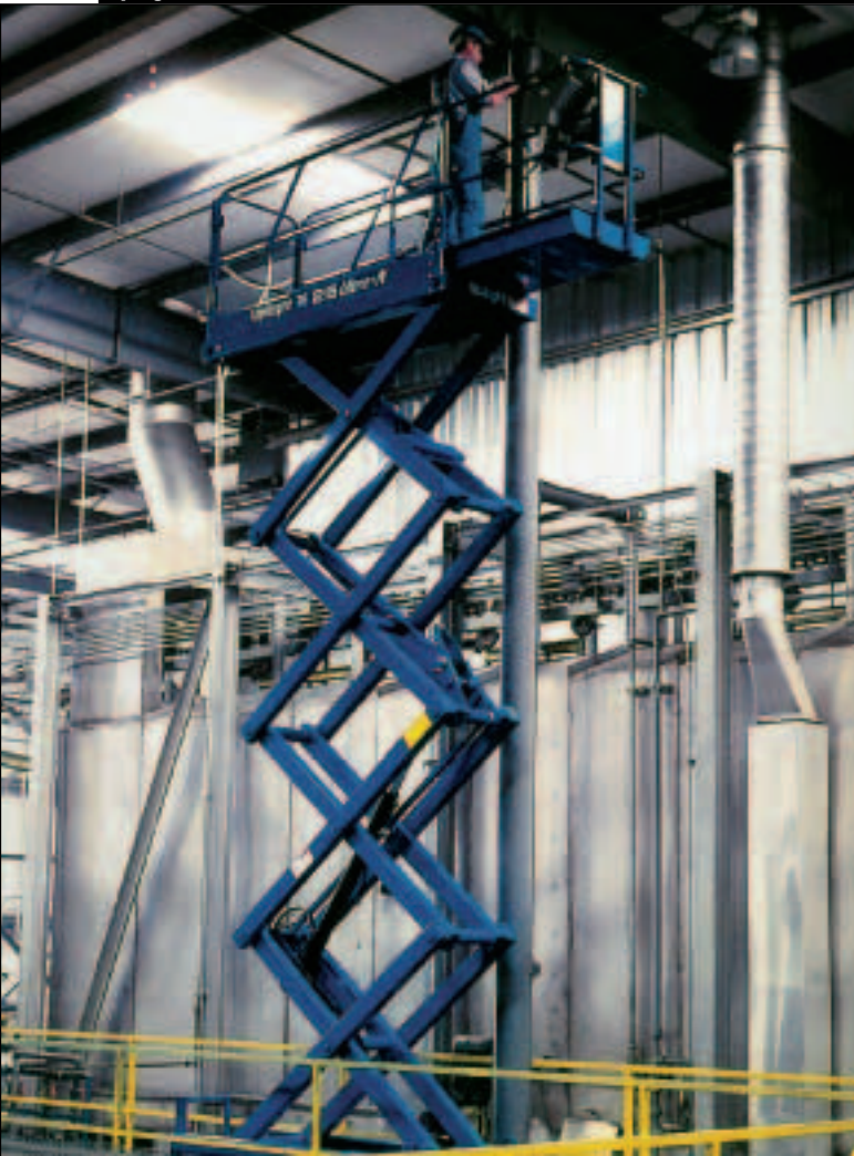
UpRights neue schmale Schere X26 Ultra-N