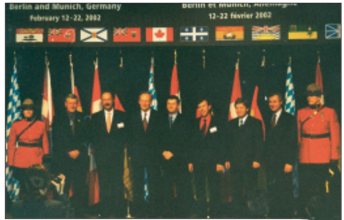
Während der jüngsten Reise der kanadischen Handelsdelegation unter Leitung des kanadischen Premierminister Jean Chrétien (vierter von links) vereinbarten mateco und Skyjack eine Zusammenarbeit bei der Entwicklung und Weiterentwicklung neuer und bestehende Modelle.

Eine Zusammenarbeit in der Entwicklung und Weiterentwicklung von Hubarbeitsbühnen haben Skyjack und mateco vereinbart. Die Absichtserklärung beider Unternehmen wurde im Rahmen der Reise einer kanadischen Handelsdelegation geleitet von dem kanadischen Premierminister in München unterzeichnet.