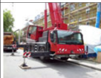
55/60 t, Liebherr LTM 1055, 2005