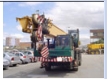
35 t, PPM Terex ATT 400, 1998 35 t, PPM Terex ATT 400/3, 2002