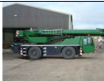
35 t, Demag AC 35, 2003