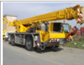
30 t, Faun ATF 30-2L, 1998

E-Mail: andreas.moeller@zr-arbeitsbuehnen.de