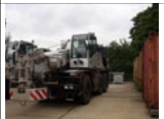
40 t, Demag AC 40, 2003 40 t, Demag AC 40, 2004