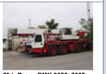
50 t, Grove GMK 3050, 2002 50 t, Grove GMK 3050, 2001 50 t, Grove GMK 3050, 1998