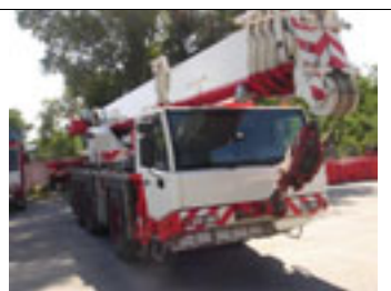
60 t, Faun ATF 60-3, 2004