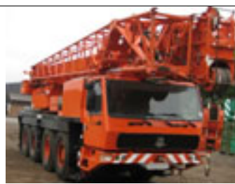
75 t, Grove GMK 4075, 2001