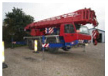
45 t, Tadano Faun ATF 45-3, 2002