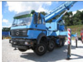
30 t, Liebherr LTF 1030, 1995