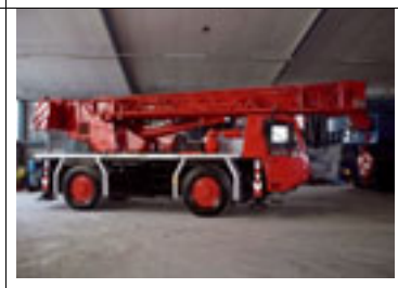
30 t, Faun ATF 30-2L, 1998