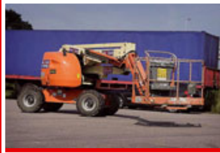
JLG 450AJ sn: 0662 Year 2004 Working height 15.72 m