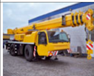
35 t, Demag AC 35, 2003