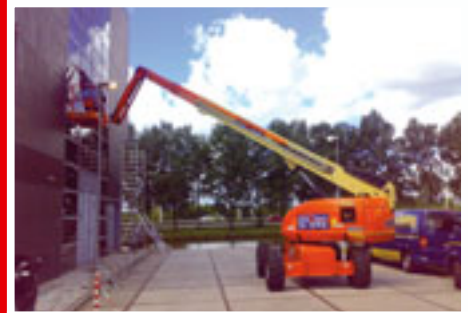
JLG 660SJ sn: 84265 Year 2005 Working height 22.00 m