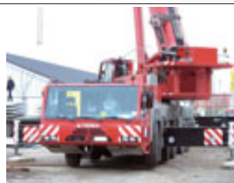
160 t, Demag AC 160, 2005