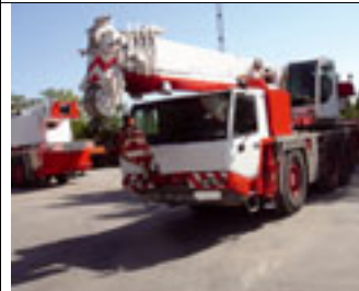
60 t, Faun ATF 60-3, 2004