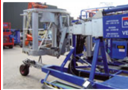
DL-25 sn: 12746 Year 2005 Working height 25.00 m

This is just a small selection of our stock