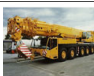
180 t, Terex Demag AC 535, 1997