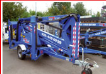
TL-49 sn: 8045 Year 2008 Working height 17.00 m