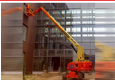
JLG 860SJ sn: 82101 Year 2005 Working height 28.00 m