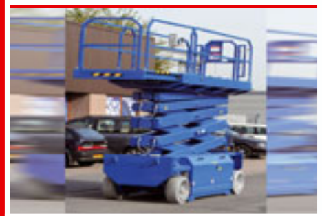
HAB S152 sn: 00000 Year 2008 Working height 15.20 m