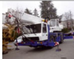
50 t, Grove GMK 3050, 2002 50 t, Grove GMK 3050, 2001 50 t, Grove GMK 3050, 1999