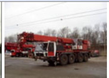
70 t, Krupp KMK 4070, 1993