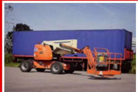
JLG 510AJ sn: 583 Year 2004 Working height 17.00 m

Please do not hesitate to contact us as our stock changes on a daily basis. We also have new machinery in stock, ALL major brands available.