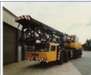
140 t, Demag TC 600, 1978