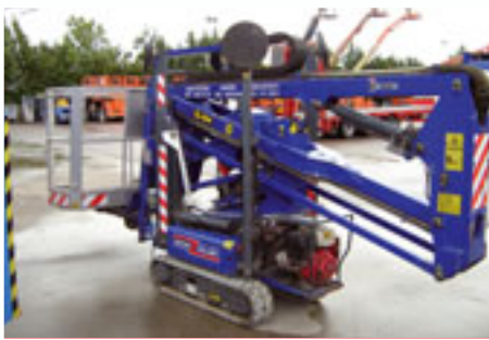
Hinowa sn: GL464 Year 2005 Working height 14.00 m