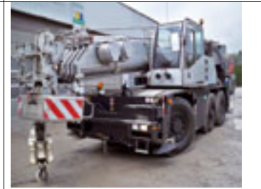
40 t, Demag AC 40, 2003