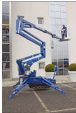
CTE Traccess 170

LKW-Arbeitsbühnen zwischen 14 und 32 Meter sowie Raupenarbeitsbühnen aus Italien; zu sehen sind das neuste Stück mit der Bezeichnung Zed 21, ein Gelenkteleskop auf 3,5-Tonner, sowie ein Raupengelenkteleskop vom Typ Traccess 170.