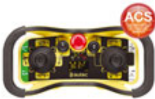
Autec MJ DF ACS

Autec hat seine neusten Funkfernbedienungen an Bord, darunter die MJ mit Joystick und Data-Feedback-Funktion.