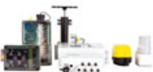
AC243 von SMIE

Französischer Spezialist für Antikollisionssysteme bei Turmdrehkränen mit weltweit rund 10.000 Systemen im Einsatz. Smie bringt zwei Neuheiten mit: Zum einen das AC243, welches Smie zufolge das einzige Antikollisionssystem ist, das bis zu 14 Krane auf einmal, also im selben