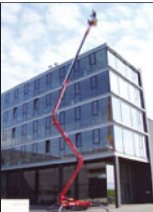
Hinowa Lightlift 23.12

Hinowa bringt die jüngste Neuheit mit: die 23-Meter-Raupe Light Lift 23.12 mit zwölf Metern Reichweite. Mit knapp sechs Metern Länge und an die drei Tonnen Gewicht ist die 23.12 keine Kompakte mehr. Ebenso neu von Hinowa ist ein 1600 Watt starkes Lichtmast-Set, das statt des Korbes angebracht werden kann und die Bühne so in einen Lichtmast auf Raupenkette verwandelt.