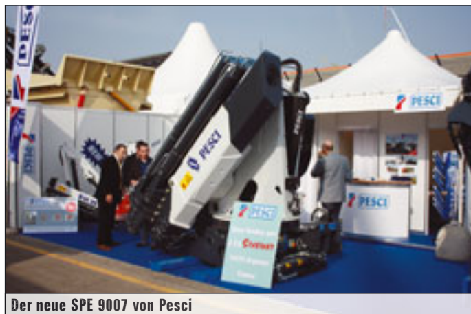
Der neue SPE 9007 von Pesci

An Fleiß hat es auch Effer nicht mangeln lassen. Mit den neuen Modellen „575“ und „655“ ist das Unternehmen zur SAIE gekommen. Den „575“ gibt es mit bis zu neun Ausschüben und einer Reichweite von 23 Metern oder mit Jib und einer Ausladung bis knapp an die 30 Meter. Von den Reichweiten kommt