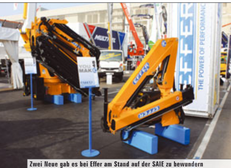
Zwei Neue gab es bei Effer am Stand auf der SAIE zu bewundern

Die Schwackeliste für LKW-Ladekrane ist neu erschienen. Der Leitfaden listet auf über 500 Seiten die Gebrauchtpreise fast aller Modelle der unterschiedlichsten Hersteller auf. „LKW-Ladekrane, Wechselsystem, Hubladebühnen“ wird vom Lectura-Verlag jährlich aufgelegt.