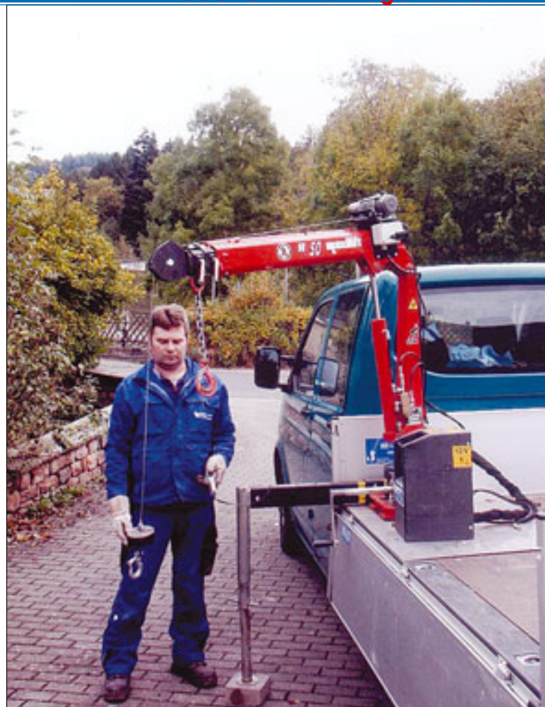
Einfach gestaltet und einfach zu bedienen, die Geräte von Maxilift

ertonnen-Kran auch durch diese Zusatzfunktionen nicht beeinflusst und die Ladelänge kann größer oder der Radstand