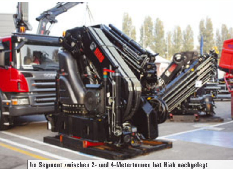
Im Segment zwischen 2- und 4-Metertonnen hat Hiab nachgelegt

In diesem Jahr hat Fassi seinen Schwerpunkt auf die Präsentation der neuen Lastmomentbegrenzung FX500 gelegt. Das System, das für den Einbau in leichten und mittelschweren Kränen gedacht ist, steuert die an den Kränen vorhandenen Sicherheitsvorrichtungen völlig selbstständig und interagiert mit der Leistungskontrolle sowie mit der Funktions- und Betriebssteuerung, wodurch deren Bedienung vereinfacht wird.