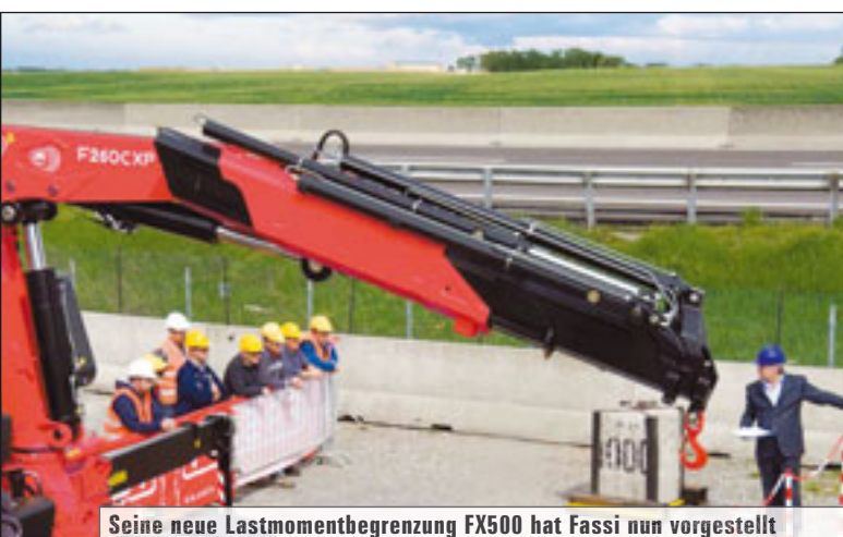
Seine neue Lastmomentbegrenzung FX500 hat Fassi nun vorgestellt

Die Unternehmen haben trotz oder wegen der schlechten Marktlage weiter an ihren Geräten entwickelt und das Programm peu à peu überarbeitet. Einen Vorgeschmack auf das kommende Jahr lieferte Palfinger auf der SAIE, die Ende Oktober nach Bologna eingeladen hatte. Die „High Performance“-Baureihe ist um fünf neue Krane aus der 20- und 30-Metertonnenklasse erweitert worden. In Italien feierten die Modelle PK 23502, PK 26002 EH, PK 30002, PK 30002 K und PK 33002 EH Premiere. Nach zwei Jahren High Performance ist die Markt- und Technologieführerschaft des österreichischen Kranherstellers unbestrittener denn je, ist sich das Unternehmen sicher. ►►