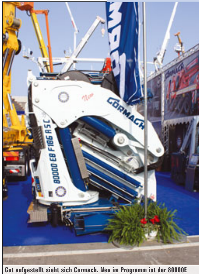
Gut aufgestellt sieht sich Cormach. Neu im Programm ist der 80000E

Im Frühjahr hat Hiab drei neue Krane der XS-Reihe vorgestellt. Bei den Geräten der 2- bis 4-Metertonnenklasse, dem XS 022, 033 und 044, hat Hiab nach eigenem Bekunden Wert auf eine perfekte Kombination von einfacher Bedienung und exzellenter Kranleistung für eine Fülle von Anwendungen geachtet. Sie sind für den Aufbau auf leichteren Fahrzeugen entwickelt und bieten dank der vertikalen Einbauposition der