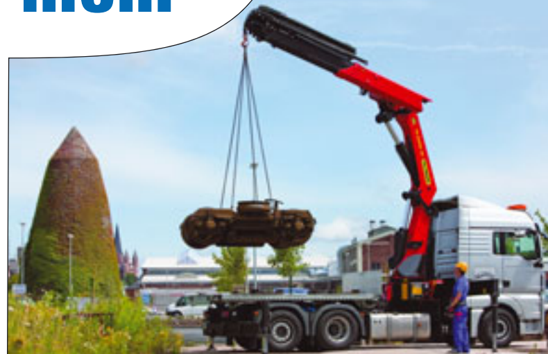
Palfinger erweitert seine „High-Performance“-Baureihe in der 20- bis 30-Metertonnen-Klasse

Den Herstellern wird durch die neuen Auflagen durchaus einiges abverlangt und das in dieser Zeit, da sich die Konjunk-