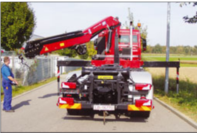
Der EN12999 um zwölf Jahre voraus wähnt sich HMF

HMF hat in diesem Jahr seine neue Baureihe von 18- bis 24-Metertonnen vorgestellt. Wie bereits in der kleineren 13- bis 17-Metertonnen-Klasse wurde laut Unternehmen besonderen Wert gelegt auf eine geschützte Schlauchverlegung, ein extrem geringes Eigengewicht und Einbaumaß. Es kommen bis zu acht hydraulische Teleskope mit einer hydraulischen