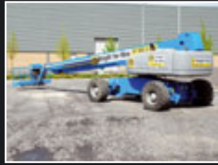
Genie S-125 Teleskopbühne 40m - 2005/6/7/8/9