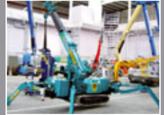
MAEDA MC 285 CRME Mini-kran 8,7m/2.8 Tonnen - 2006/7