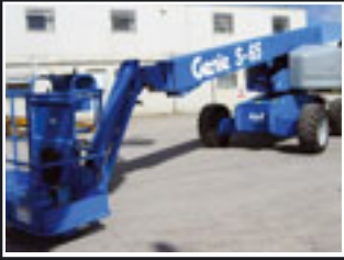
Genie S-65 Teleskopbühne 21.8m - 2005/6/7