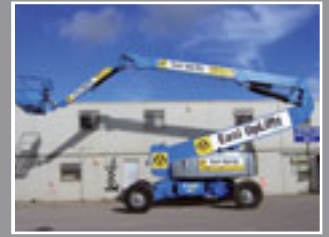
Genie Z135/70 Teleskopgelenkbühne 43.15m - 2007/8