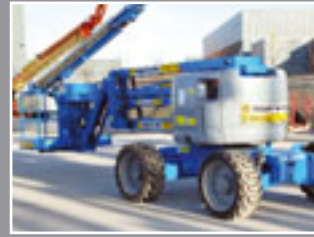
Genie Z-45/25RT Teleskopgelenkbühne 16m - 2005/6/7/8