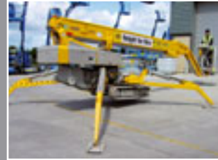
Omme 3000 RBD Spezial Gerät 30m - 2006/7