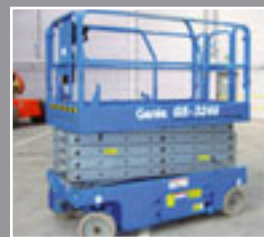
Genie GS-3246 Elektro Scherenbühne 11,75m - 2005/6