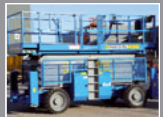
Genie GS-5390 RT Diesel Scherenbühne 18m - 2006/8