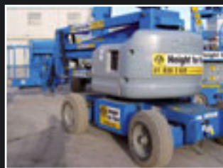
Genie Z-45/25J Bi Energy Teleskopgelenkbühne 16m - 2002/3/4/5/6