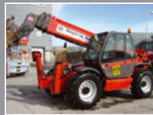
Manitou MT 1740 Telestapler 17m/4 Tonnen - 2005/6/7