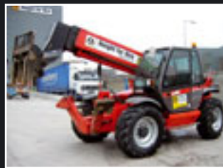
Manitou MT 1335 Telestapler 13m/3.5 Tonnen - 2005