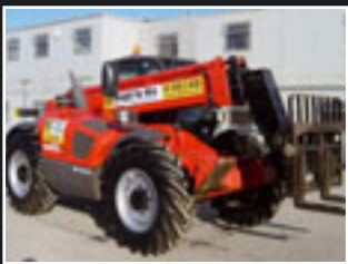
Manitou MT 1030 Telestapler 10m/3 Tonnen - 2005/6/8