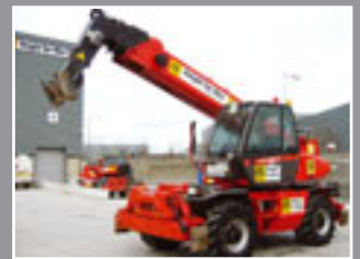
Manitou MRT 2150 Telestapler 21m/5 Tonnen - 2005/6