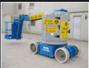
Genie Z-30/20NRJ Elektro Teleskopgelenkbühne 11m - 2006