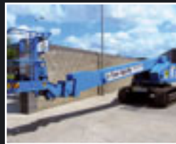
AICHI SR21A Ketten Teleskopbühne 23m - 2006