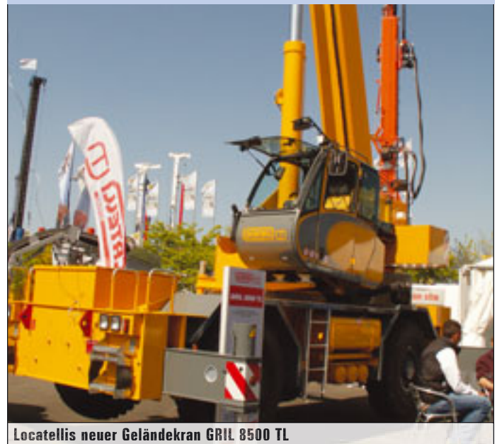
Locatellis neuer Geländekran GRIL 8500 TL

Mit einem eigenen Konzept kam Anfang der 1990er-Jahre Spierings auf den Markt, den mobilen Turmdrehkrane. Seit