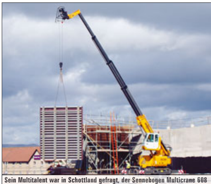
Sein Multitalent war in Schottland gefragt, der Sennebogen Multicrane 608

Vieles ist in diesem Frühjahr auch bei Tadano Faun bewegt worden. Zwei neue Fünfachser sind bei den Laufern hinzugekommen. Mit dem ATF 130G-5 wird die Lücke zwischen dem 110- und 160-Tonner geschlossen. Der 130-Tonner hat Allradlenkung als Standard. Die erste und zweite Achse sind mechanisch, die dritte