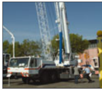
Auch Zoomlion hat sich in Paris der europäischen Öffentlichkeit gezeigt

Einen neuen Aufbaukran hat Marchetti in diesem Frühjahr mit nach Paris gebracht. Auf der Intermat feierte der MTK 60 sein Debüt. Der 60-Tonner, aufgebaut auf einem Vierachs-Chassis, kommt auf eine Hauptauslegerlänge von 40 Metern, die mit einer Klappspitze um 14,5 Meter erweiterbar ist. Mit dem Gegengewicht von sechs Tonnen hat der Kran ein Gesamtgewicht von 41 Tonnen. Die Achslast bleibt innerhalb der Zwölf-Tonnen-Grenze.