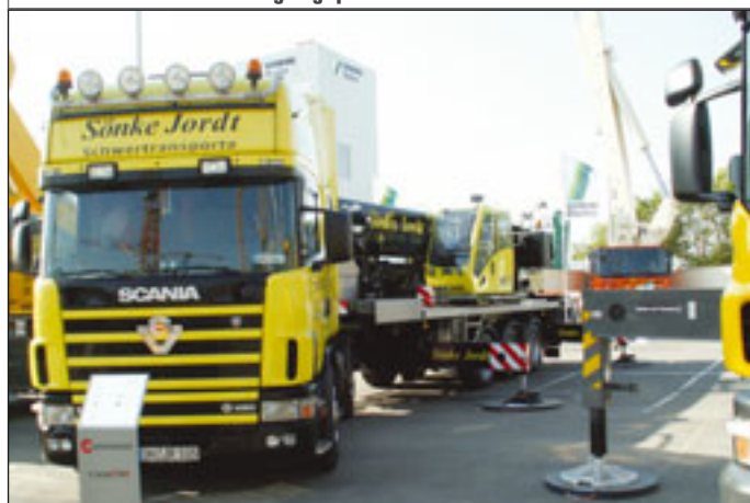
Den Kran auf einen Anhänger gepackt hat Grove mit dem GMK 3055

Seine maximale Tragfähigkeit beträgt 40 Tonnen. Mit der Acht-Meter-Hauptauslegerverlängerung wird eine maximale Rollenlänge von 47 Metern erreicht. Terex-Bendini hat vergangenen Herbst seine volle Palette an Geländekranen aufgefahren, den RC 30, den RC 34 und RC 60. Das jüngste Modell ist der RC 34. Voll ausgefahren erreicht sein ▶▶