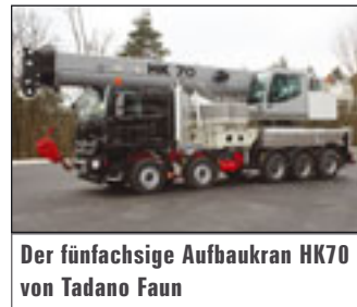
Der fünfachsiges Aufbaukran HK70 von Tadano Faun

Optimierungen in ihrem Fuhrpark vor. Nichtsdestotrotz wird genau geschaut, was es am Markt für Möglichkeiten gibt und welche Neuheiten interessant sein könnten. Und hier sind die Hersteller nicht untätig.