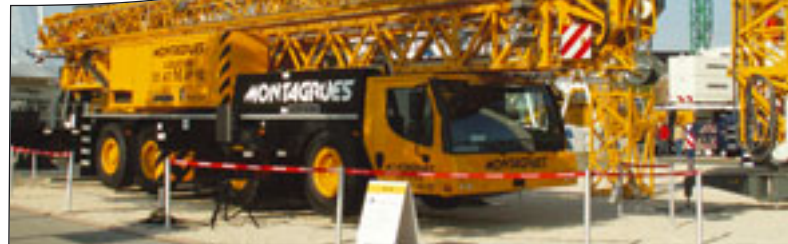
Mit dem MK 88 bringt Liebherr einen Nachfolger im Vierachs-Segment seiner Mobilbaukrane auf den Markt

Optimierungen in ihrem Fuhrpark vor. Nichtsdestotrotz wird genau geschaut, was es am Markt für Möglichkeiten gibt und welche Neuheiten interessant sein könnten. Und hier sind die Hersteller nicht untätig.