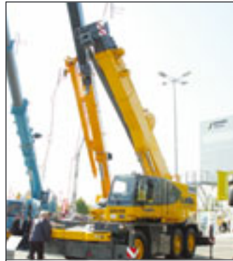
Der neue Einkabinekrane von Grove, der GCK3045

Die veränderte Wirtschaftslage ist indes bei den Vermietern angekommen. In der überwiegenden Zahl gaben diese bei unserer Umfrage unter den Top20-Firmen an, dass sie ihre Investitionen gut überlegen, manche specken auch ab oder nehmen