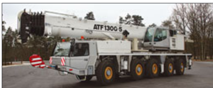
Der ATF 130G5 schließt die Lücke zwischen 100 und 160 Tonnen bei Tadano Faun

Die Präsenz chinesischer Hersteller auf dem Mobilkranmarkt wird immer deutlicher. Auf der Intermat waren mehrerer Hersteller zu sehen, die ihre Geräte mit dabei hatten. So präsentierte sich das belgische Unternehmen Michielsens zusammen mit XCMG auf einem Stand. Dort war mit dem QY25K5 ein 25-Tonner auf Dreiachsfahrgestell zu entdecken. Die maximale Hakenhöhe reicht auf 46 Meter Höhe. Der After Sales wird von Michielsens übernommen, wurde auf der Messe verlautbart. Die erste Krane des Typs sind bereits nach Großbritannien ausgeliefert worden. Ein 50-Tonner ist