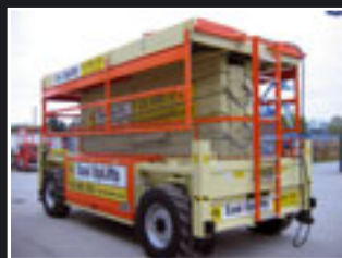
JLG 245-25 Diesel Scheren 24.5m - 2007/8