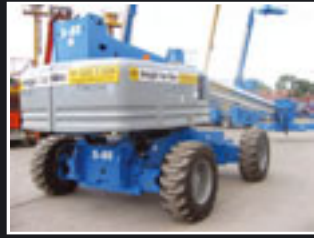
Genie S-85 Teleskopbühne 27.9m - 2005/6/7