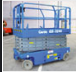
Genie GS-3246 Elektro Scheren 11.75m - 2004/5/6/7