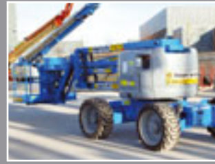
Genie Z-45/25RT Teleskopgelenkbühne 16m - 2004/5/6/7/8