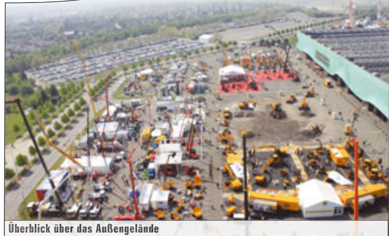
Überblick über das Außengelände

vertreten. Sie verstehen dies auch als Bekenntnis gegenüber dem Markt. Ein Liebherr-Sprecher geht sogar so weit zu sagen: „Wir sind grundsätzlich optimistisch, wir erwarten für die Jahresmitte die ersten positiven Signale.“