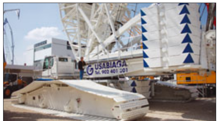
Liebherr überarbeiteter Raupenkran LR1600/2

Gleich drei Neuheiten hat Manitowoc in Paris präsentiert, den