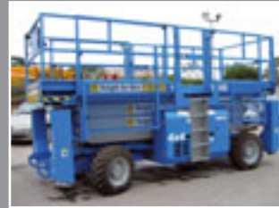
Genie GS-3384 RT Diesel Scheren 12.06m - 2006