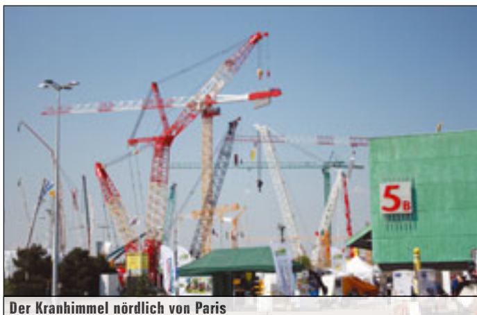
Der Krankhimmel nördlich von Paris