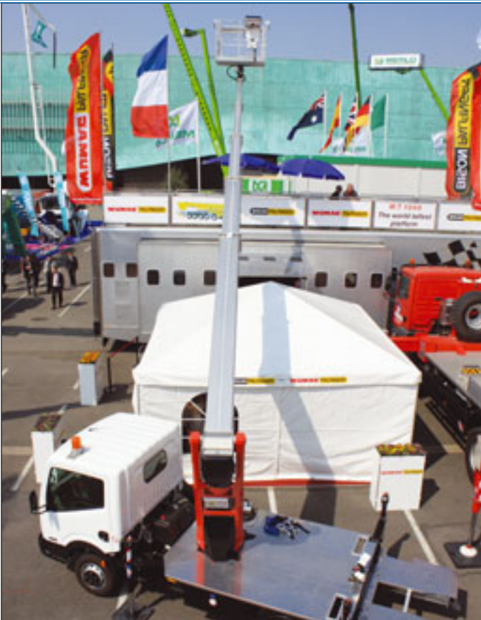
Palfinger hat die P260B neu vorgestellt

« Arbeitshöhe auf 3,5 Tonner, Bizzocchis 43-Meter-Maschine, Ruthmanns T470 sowie Hinowas Idee namens Orchidee. Mit der Orchid 21.11 geben die auf Raupenarbeitsbühnen spezialisierten Italiener ihr Debüt im LKW-Segment.