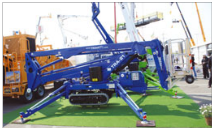
Neuer Name im Bühnen-Business: Traklift

Viele Hersteller waren über ihre Händler vertreten, so zum Bei-