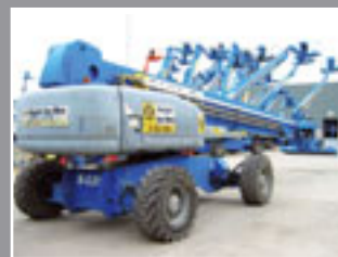
Genie S-125 Teleskopbühne 40.15m - 2004/5/6/7/8