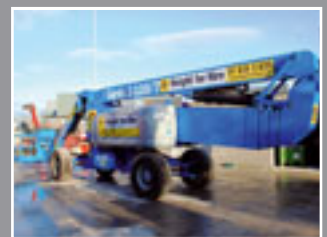
Genie Z-135/70 Teleskopgelenkbühne 43.15m - 2007