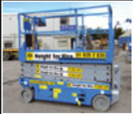
Genie GS-2632 Elektro Scheren 8.1m - 7/6/2005