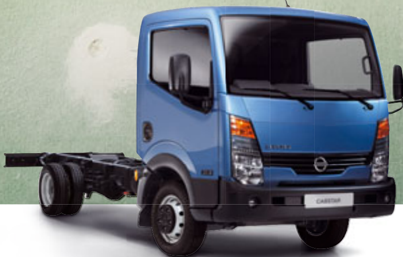
Abb. zeigt Sonderausstattung.