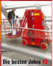
Die besten Jahre 43