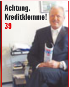
Achtung, Kreditklemme! 39