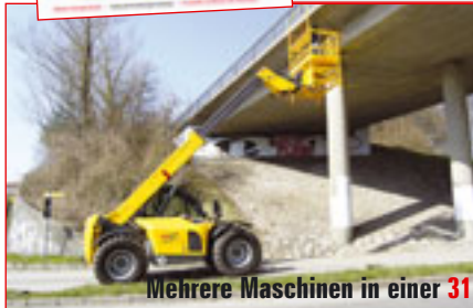
Mehrere Maschinen in einer 31