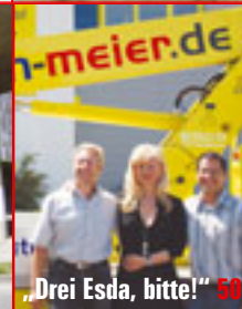
„Drei Esda, bitte!“ 50