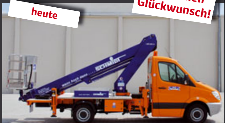
STEIGER® TB 220: 22,1 m Höhe, 14 m Reichweite, 3,5 t ZGG.