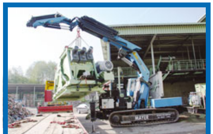
Ungewöhnliches Bild: Das Unternehmen Mayer Autokran hat einen „normalen“ Schwerlastkran PK 150002 von Palfinger auf Raupenfahrgestell geordert. Hier ging es im Geiger-Werk Betzigau um den Austausch eines Nachzerkleinerers mit einem Gewicht von knapp 16 Tonnen.

von unserem Auftragsbestand. Unsere tatsächlichen Auftragseingänge lagen in den letzten sechs Monaten um 40 Prozent unter dem vergleichbaren Vorjahreswert. Wenn das länger anhält, wird es schwierig.“ Die Liebherr-Werk Biberach GmbH hat aufgrund der Auftragsituation ab Juli 2009 Kurzarbeit für sechs Monate beantragt. Der mit Mobil- und Raupenkränen erzielte Umsatz nahm um 14,2 Prozent oder 236 Millionen Euro zu und erreichte insgesamt 1,903 Milliarden Euro. In den letzten fünf Jahren hat sich der Umsatz dieser Sparte fast verdoppelt. Stark gewachsen ist erneut die Sparte Maritime Krane. Es wurde insgesamt ein Umsatz von 628 Millionen Euro erreicht. Im Vergleich zum bereits hohen Vorjahreswert entspricht dies einer Steigerung um 17 Prozent oder 92 Millionen Euro.