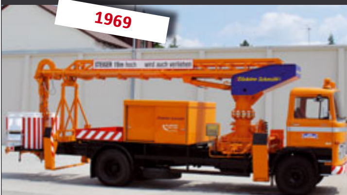
STEIGER® K 170: 19 m Höhe, 16 m Reichweite, 15 t ZGG.