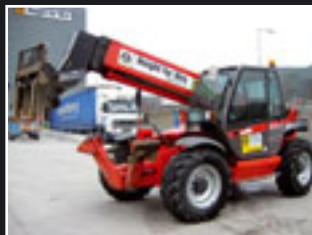
Manitou MT 1335 Telesapler 13m/3.5 Tonne - 2005