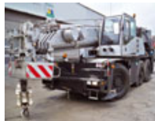
Demag AC 40, 2003