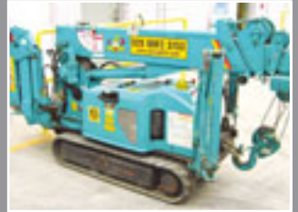
MAEDA MC104 CRG, Mini-Kran, 5.50m, 1 Tonne – 2003