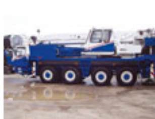
Grove GMK 4075, 2001