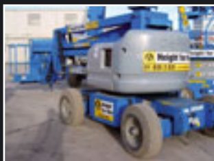
Genie Z-45/25J Bi Energy Teleskopgelenkbühne 16m - 2002/3/4/5/6