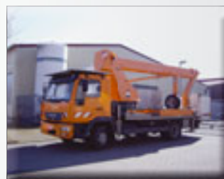
Wumag WT 230

Ihr Spezialist in Sachen gebrauchter und isolierter Höhenzugangstechnik