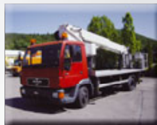
BST 25 Meter