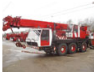
Krupp KMK 3045, 1993