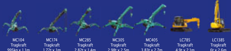
MC104 Tragkraft 995kg x 1.1m