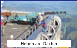
Heben auf Dächer