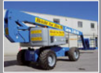
Genie Z-80/60 Teleskopgelenkbühne 26.4m - 2004/5/6/7/8