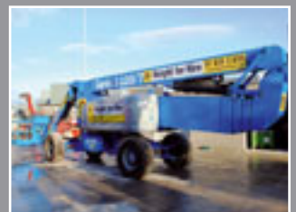
Genie Z-135/70 Teleskopgelenkbühne 43.15m - 2007