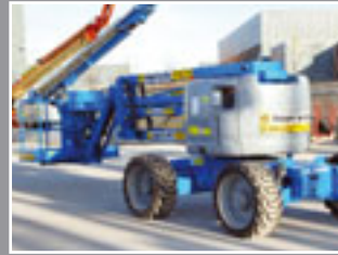
Genie Z-45/25RT Teleskopgelenkbühne 16m - 2004/5/6/7/8