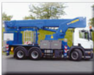
Bison TKA 47