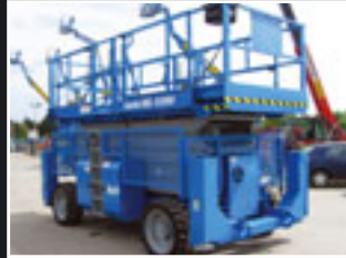
Genie GS-5390 RT Diesel Scheren 18.5m - 2005/6/7