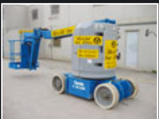
Genie Z30/20NRJ, Elektro Teleskopgelenkbühne, 11m - 2006