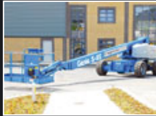
Genie S-85 Teleskopbühne 27.9m - 2005/6/7