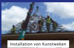
Installation von Kunststeinen