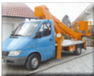
Wumag WT 200