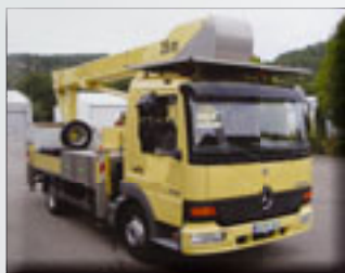
Bison TKA 26 KS