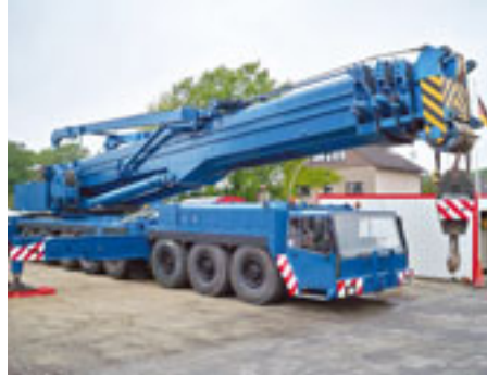
400 t, Liebherr LTM 1400, 1998

Tel: +49 (0) 2365 69 88 20 Fax: +49 (0) 2365 69 88 210 D-45770 Marl Mail: mail@immo-cranes.com Web: www.immo-cranes.com