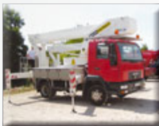
Bison TKA 28 KS