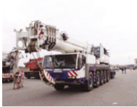
100 t, Demag AC 100, 2000