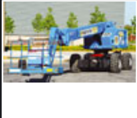
AICHI SP21 AJ, Teleskopbühne, 23m – 2005/6