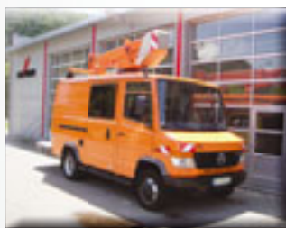
Wumag WGT 130