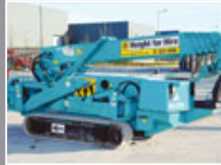
MAEDA MC 305 CRM-E, Mini-Kran, 12m, 3 Tonne – 2006