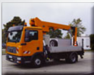
Versalift VT 51