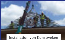
Installation von Kunstweken