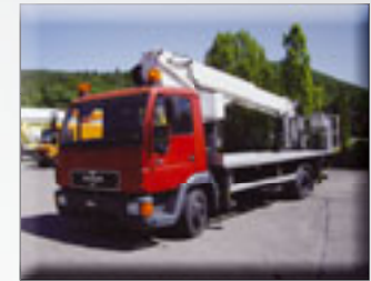
BST 25 Meter