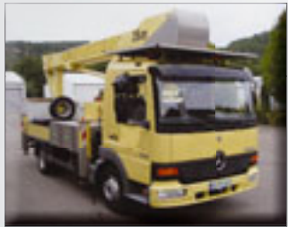
Bison TKA 26 KS