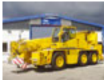
40 t Terex Demag AC 40-1, 1999