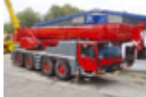
80 t Liebherr LTM 1080-1, 2004