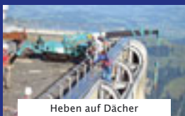
Heben auf Dächern