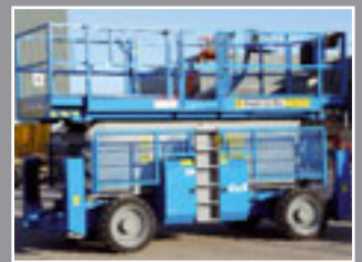
Genie GS-5390 RT Diesel Scherenbühne 18m - 2006/8