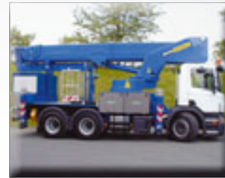
Bison TKA 47