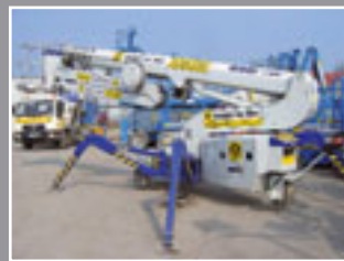
Spider FS290 Spezial Gerät 29m - 2005