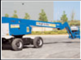
AICHI SP21 AJ Teleskopbühne 23m - 2005/6