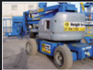
Genie Z-45/25J Bi Energy Teleskopgelenkbühne 16m - 2002/3/4/5/6