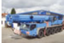
100 t Terex Demag AC 100, 2003

Wir können für deutsche Kunden Finanzierungen (Mietkauf) vermitteln!!