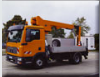
Versalift VT 51