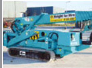
MAEDA MC 305 CRM-E Mini-kran 12.m/3 Tonnen - 2006