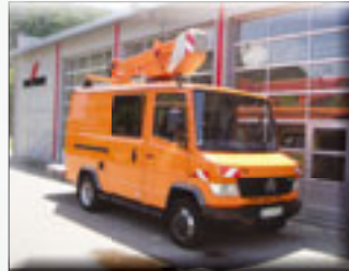
Wumag WGT 130