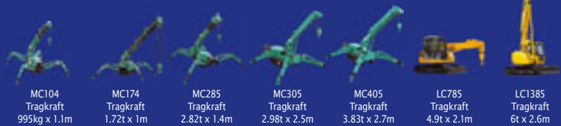
MC104 Tragkraft 995kg x 1.1m