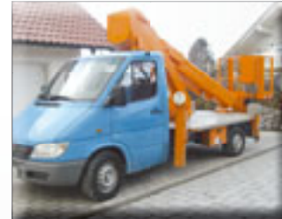
Wumag WT 200