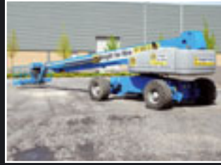
Genie S-125 Teleskopbühne 40m - 2005/6/7/8/9