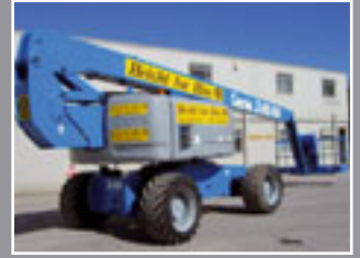
Genie Z-80/60 Teleskopgelenkbühne 26.4m - 2004/5/6/7/8