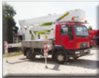
Bison TKA 28 KS