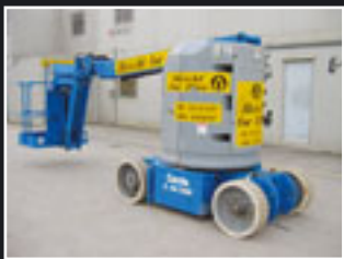
Genie Z-30/20NRJ Elektro Teleskopgelenkbühne 11m - 2006