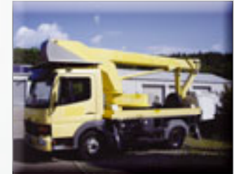
Bison TKA 19 KS

Ihr Spezialist in Sachen gebrauchter und isolierter Höhenzugangstechnik