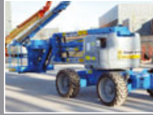
Genie Z-45/25RT Teleskopgelenkbühne 16m - 2004/5/6/7/8