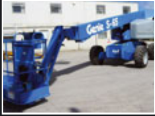
Genie S-65 Teleskopbühne 21.8m - 2005/6/7