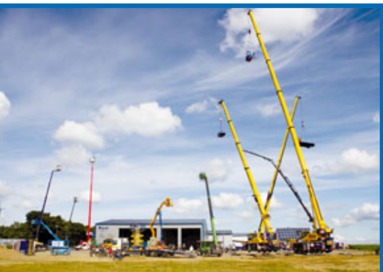
Kurth Autokrane hat seinen neuen Betriebssitz in Blankenheim in der Eifel feierlich eingeweiht: Er umfasst eine Fläche von 10.000 Quadratmetern und eine Hallenfläche von 750 Quadratmetern.