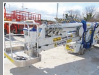
Spider FS290 Spezialgerät 29m - 2005