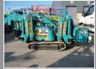
Maeda MC 285 CRM-E Mini-Kran 8,70m/2,8Tonnen - 2007