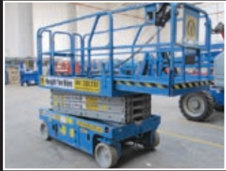
Genie GS-2646 Elektro Scheren-Bühne 9,75m/318kg - 2004/5/6/7/8