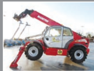
Manitou MT1840 PRIVILEGE Telestapler 18m/4Tonnen - 2008