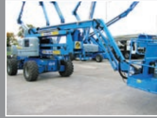
Genie Z-60/34 Gelenkauslegerbühnen 20,40m - 2003/4/5/6/7/8