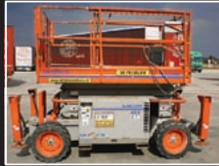
Skyjack SJ-6832 Diesel Scheren-Bühne 11,58m/386kg - 2007/8