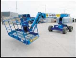
Genie S-45 Teleskopgelenkbühne 15,72m - 2005/06/07