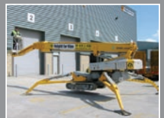
Omme 3000 RBD Spezialgerät 30m - 2006/7/8