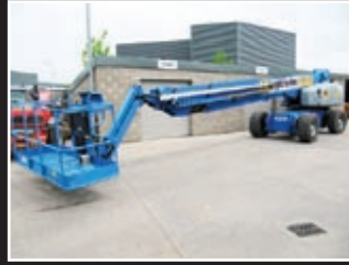
Genie S-125 Teleskopgelenkbühne 40,13m - 2006/7/8/9