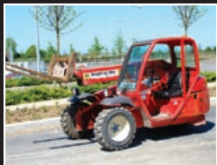
Manitou SLT415 Telestapler 4m/1,5Tonnen - 2003/4