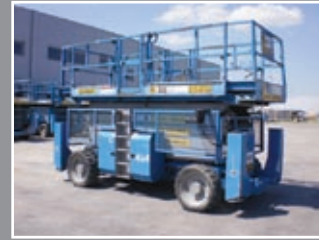
Genie GS-5390 RT Diesel Scheren-Bühne 18m/680kg - 2005/6/8