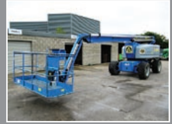
Genie Z-80/60 Gelenkauslegerbühne 26,39m - 2005/6/7/8/9