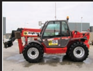
Manitou MT 1740 SLT Telestapler 17m/4Tonnen - 2005/6/7