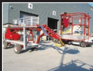
Scanlift SL190D Spezialgerät 18,5m - 2001