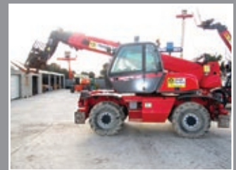
Manitou MRT 2150 M Telestapler 21m/5Tonnen, 2006/7