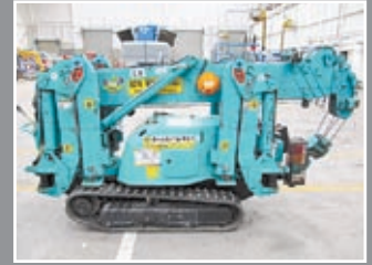
Maeda MC 285 CRM Mini-Kran 8,70m/2,8Tonnen - 2006