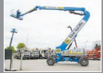
Genie Z-135/70 Gelenkauslegerbühnen 43,15m - 2007/8/9