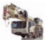
Road Mobile Cranes