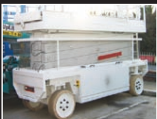
Liftflux SL153-12 Elektro Scherenbühne 17m - 2001