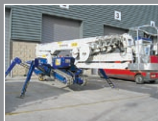
Spider FS420 Spezialgerät 42m - 2008