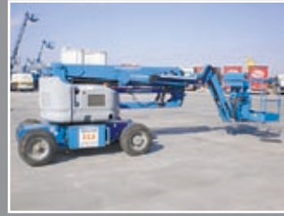
Genie Z-45/25JB Gelenkauslegerbühnen 15.92m - 2005/6