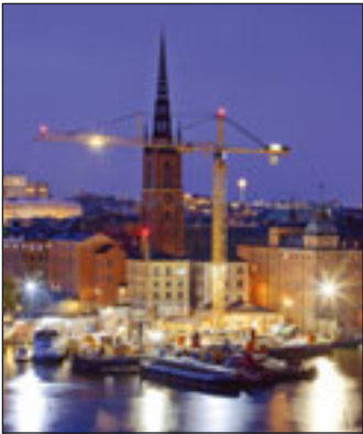
Ein Liebherr aus der EC-H-Baureihe in Stockholm

◀ Schärfe, Auflösung und somit Detailreichtum von Großformat-Fotografien sind allen kleineren Formaten (noch) überlegen – so kann er ein schönes Kranbild auf drei Meter hochziehen – für ein Poster zum Beispiel. „Für ein Top-Motiv lohnt sich das“, ist der Fotograf überzeugt. Und er hat ja auch noch seine digitalen