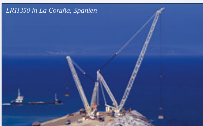
LR11350 in La Coruña, Spanien

Doch bei herausragenden Motiven greift er dennoch gerne zu seiner analogen Kamera, die voll aufgebaut über einen Meter Länge erreichen kann. Warum all diese Mühe? Ist das nicht ein wandelnder Anachronismus? „Klar“, gibt Wilhelm zu, „das ist völlig antiquiert.“ Doch ▶▶