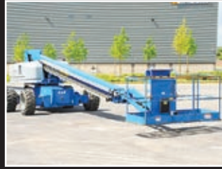
Genie S-85 Teleskopgelenkbühne 27,91m - 2005/06/7/8