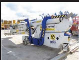
Spider FS290 Spezialgerät 29m - 2005