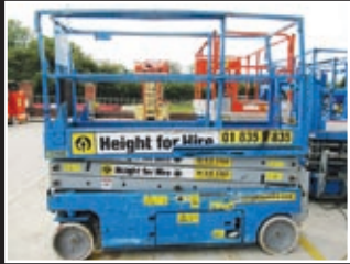
Genie GS-2032 Elektro Scheren-Bühne 8,10m - 2005/6