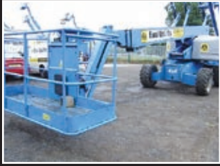
Genie S-65 Teleskopgelenkbühne 21,91m - 2005/06/07/08