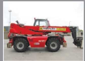
Manitou MRT 2150 M Telestapler 21m/5Tonnen, 2006/7