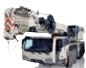
Road Mobile Cranes

BESUCHEN SIE UNS INTERMAT 16.-21. APRIL 2012 · PARIS STAND E5 C 002