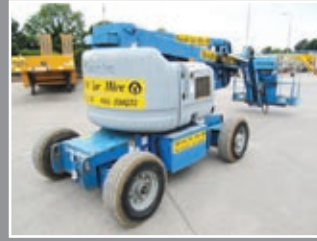
Genie Z-45/25J Bi Gelenkauslegerbühnen 15.92m - 2005/6