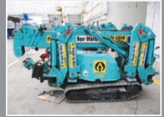
Maeda MC 285 CRM Mini-Kran 8,70m/2,8Tonnen - 2006