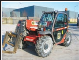
Manitou MLT523T Telestapler 5m/2,3Tonnen - 2006/7