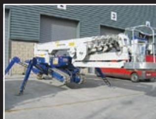
Spider FS420C Spezialgerät 42m - 2008