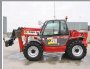
Manitou MT174OSLT Telestapler 17m/4Tonnen - 2005/6/7