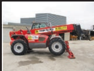
Manitou MT 1435 Telestapler 14m/3,5Tonnen - 2006/7