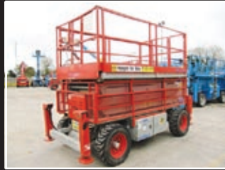
Skyjack SJ-7135 Diesel Scheren-Bühne 12,50m - 2006/07/8