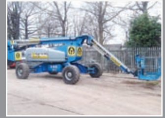
Genie Z-135/70 Gelenkauslegerbühnen 43,15m - 2007/8/9