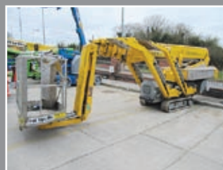
Omme 2200RBD Spezialgerät 22m - 2006