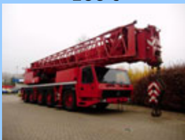
Grove GMK 5100, 2001