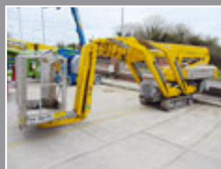
Omme 2200RBD Spezialgerät 22m - 2006