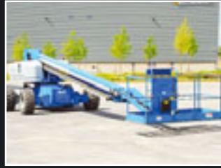
Genie S-85 Teleskopgelenkbühne 27,91m - 2005/06/7/8