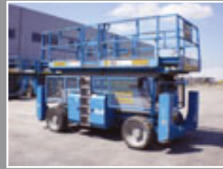
Genie GS-5390 RT Diesel Scheren-Bühne 18m/680kg - 2005/6/8