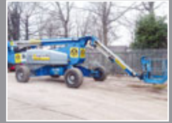
Genie Z-135/70 Gelenkauslegerbühnen 43,15m - 2007/8/9