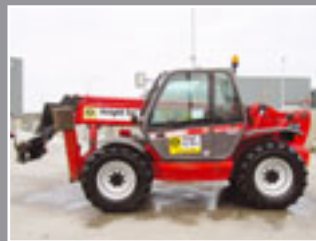
Manitou MT174OSLT Telestapler 17m/4Tonnen - 2005/6/7