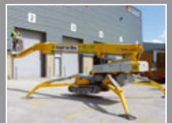
Omme 3000 RBD Spezialgerät 30m - 2006/7/8