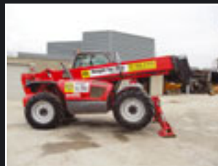
Manitou MT 1435 Telestapler 14m/3,5Tonnen - 2006/7