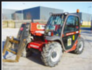
Manitou MLT523T Telestapler 5m/2,3Tonnen - 2006/7