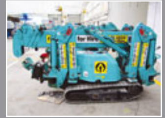
Maeda MC 285 CRM Mini-Kran 8,70m/2,8Tonnen - 2006