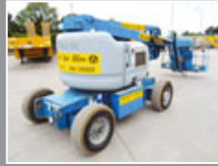
Genie Z-45/25J Bi Gelenkauslegerbühnen 15.92m - 2005/6