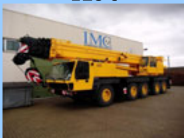
Krupp KMK 5120, 1994