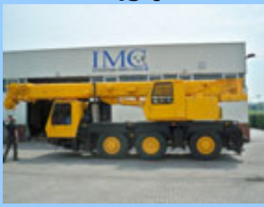
Krupp KMK 3045, 1993