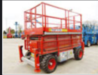
Skyjack SJ-7135 Diesel Scheren-Bühne 12,50m - 2006/07/8