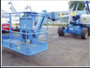
Genie S-65 Teleskopgelenkbühne 21,91m - 2005/06/07/08