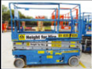
Genie GS-2032 Elektro Scheren-Bühne 8,10m - 2005/6