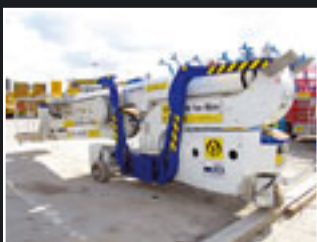
Spider FS290 Spezialgerät 29m - 2005