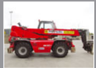
Manitou MRT 2150 M Telestapler 21m/5Tonnen, 2006/7