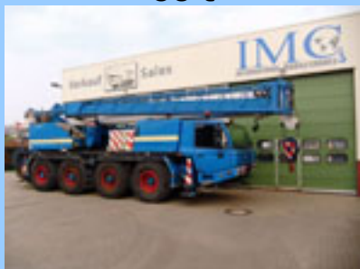
Tadano Faun ATF 60-4, 2000