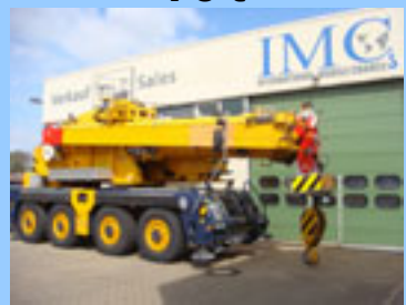
Demag AC 60, 2002