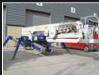
Spider FS420C Spezialgerät 42m - 2008