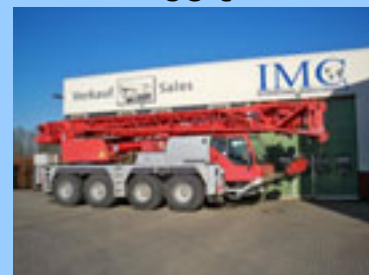
Liebherr LTM 1060-2, 2001