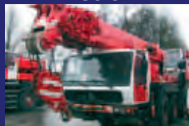
Grove GMK 4080, 1996