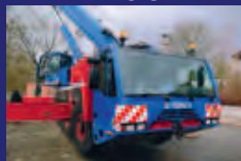
Demag AC 120-1/140, 2005