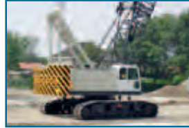
SCX900 90T 2008