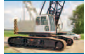
SCX800 80T 2009