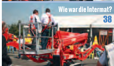
Wie war die Intermat? 38