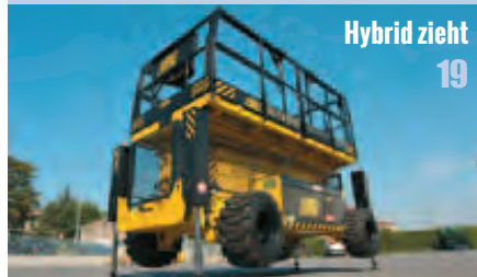
Hybrid zieht 19