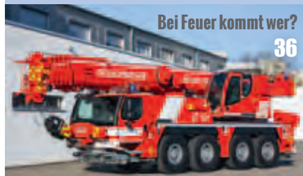
Bei Feuer kommt wer? 36