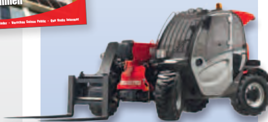
Frisch gestapelt 27