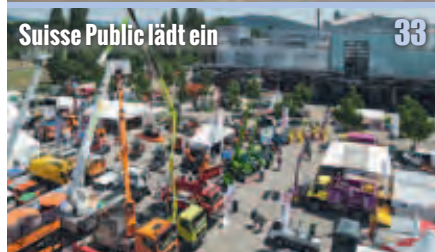
Suisse Public lädt ein 33