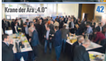
Krane der Ära „4.0“ 42